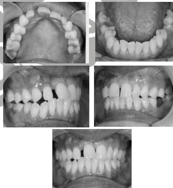
Gambar 2. gambar intra oral sebelum perawatan