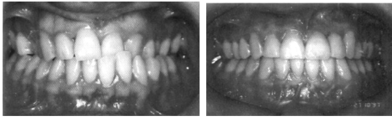
Gambar 1. Foto intraoral sebelum dan setelah perawatan dengan pembukaan ruangan, agenesis insisif lateral digantikan dengan single tooth implant 9

Keuntungan pembukaan ruangan untuk kehilangan insisif lateral maksila adalah fungsional maupun oklusi yang baik dan menghasilkan interkusipasi yang ideal dari kaninus sampai molar satu, serta waktu perawatan yang lebih singkat. Kerugian utama bagi pembukaan ruangan secara ortodontik adalah komitmen pasien terhadap protesa yang permanen dalam hal shade gigi, kontur gingiva dan margin yang tidak selalu mudah untuk dikontrol. Selain itu bila menggunakan gigi tiruan cekat ada kemungkinan perlu diperbaiki pada masa akan datang. 6