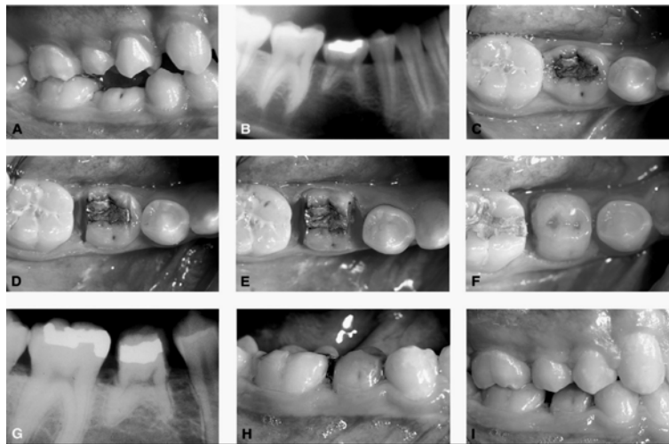
Gambar 4. Pasien wanita dengan agenesis premolar 2 bawah, terdapat molar 2 sulung bawah dan terbenam di bawah bidang oklusal. B. Radiograf menunjukkan akar molar 2 sulung tidak resorpsi, karena level tulang antara molar sulung dan molar satu, datar maka gigi dipertahankan. C-E. Gigi terlalu lebar sehingga permukaan mesial dan distal diasah. F&G. Composite build up pada gigi molar sulung. H&I. Pulpa tidak mengalami kerusakan setelah ruangan ditutup 17

menjadi terbatas karena adanya divergensi akar. Pada kasus molar dua sulung yang infraklusi, composite build up diindikasikan untuk mencegah supraerupsi gigi lawan dan kemungkinan tipping gigi molar satu. 9