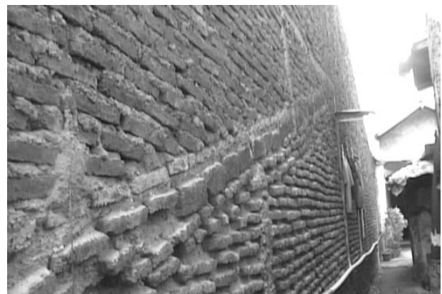
Gambar 2. Peninggian Rumah

Rob telah menyebabkan rentannya rumah warga, pencemaran lingkungan semakin parah, dan penurunan tingkat kesehatan masyarakat. Rumah warga menjadi rentan karena rumah mereka sering terendam air, tanah menjadi tidak stabil, dan pada akhirnya rumah menjadi retak. Selain itu, banyak sekali dijumpai masuknya air rob bukan hanya dari selokan ataupun saluran-saluran lain, melainkan justru muncul dari dalam tanah karena merembes keluar dari sela-sela ubin. Meskipun selokan telah tertutup oleh pipa-pipa peralon, tetapi rembesan air yang masuk lewat sela-sela ubin tetap terjadi. Tidak