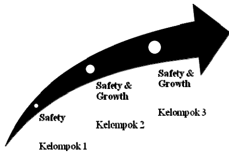
Gambar 3. Tingkatan Definisi Kualitas Rumah Menurut Preferensi Masyarakat

dilatarbelakangi kondisi lingkungan permukiman yang kurang baik, yaitu sering terjadi rob dan 'kewajiban' meninggikan rumah. Biaya peninggian rumah merupakan beban besar yang harus ditanggung setiap keluarga. Mereka juga mensyaratkan rumah yang nyaman dan bersih. Hal ini disebabkan kesibukan warga yang rata-rata bekerja sebagai buruh pabrik yang menginginkan rumah dalam keadaan bersih dan bisa untuk ketika pulang. Di samping itu, mereka juga mensyaratkan rumah yang sehat menurut preferensi mereka. Warga mempreferensikan rumah yang sehat adalah rumah yang bersih dan mendapatkan air bersih pula. Menurut mereka, syarat keluarga sehat berawal dari dua hal tersebut. Pada dasarnya, mereka juga mensyaratkan adanya jendela dan ventilasi udara pada setiap ruang rumah. Namun karena keterbatasan lahan yang dimiliki, menjadikan keinginan tersebut tidak tercapai.