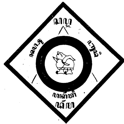
Gambar 2. Lambang Organisasi Sapta Darma