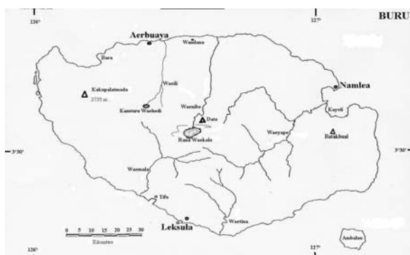
Gambar 1. Pulau Buru, Provinsi Maluku

orang Bupolo. Di antara penduduk, dibedakan antara penduduk asli ( autokton ) yang mendiami wilayah pegunungan dan terisolir dengan jumlah 9,8% (12.008), dan penduduk pendatang ( alokton ) mendiami daerah pesisir pantai. Pendatang adalah warga keturunan Cina dan Arab, ditambah dengan suku lainnya dari Nusantara. Sejarah perdagangan rempah dan kayu putih yang menghantar mereka ke pulau ini ratusan tahun yang lampau. Penduduk makin plural dengan hadirnya sekitar 10.000 tahanan politik G30S/PKI (1969-1979), dan setelah itu masuknya program transmigrasi. Mayoritas penduduk adalah petani-nelayan (pesisir pantai), sedangkan autokton di pegunungan berprofesi sebagai petani-berburu.