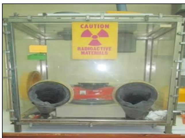
Gambar 5. Alat metalografi

Bahan aktif U-Zr juga dapat menyebabkan peralatan menjadi terkontaminasi. Peralatan yang digunakan pada kegiatan metalografi diantaranya adalah mesin gerinda/poles. Untuk menghindari penyebaran kontaminasi ke area kerja, maka alat metalografi diletakkan di dalam glovebox (Gambar 5).