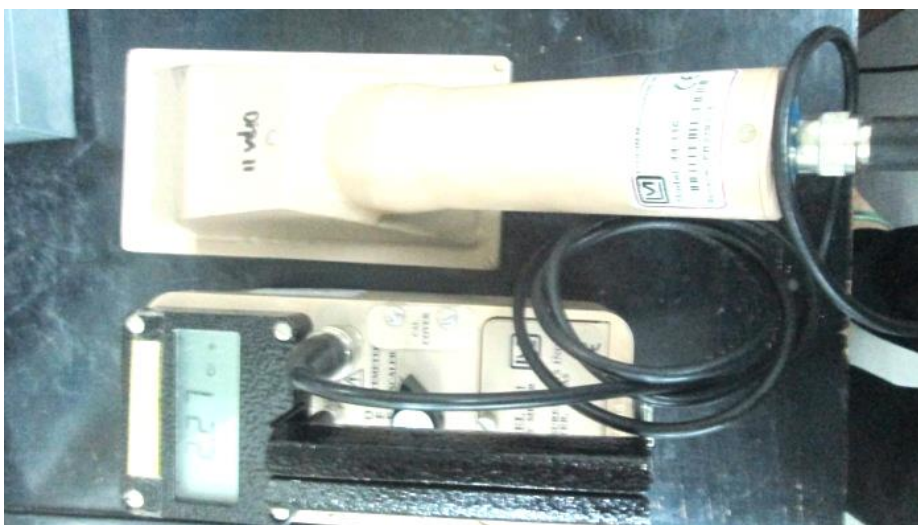
Gambar 1. Surveymeter Ludlum

pengukuran tingkat kontaminasi pada kegiatan metalografi di IEBE. Pengukuran kontaminasi dilakukan terhadap meja preparasi, peralatan metalografi yang berpotensi terkontaminasi, kemudian penanganan limbah serta pelaksanaan dekontaminasi pada meja kerja preparasi, atau lokasi penempatan sampel hasil metalografi. Tujuan dari kegiatan ini untuk mengetahui aspek keselamatan dari kegiatan metalografi di IEBE. Salah satu upaya pengawasan operasional pada penggunaan zat radioaktif adalah dengan menetapkan suatu batasan tingkat kontaminasi. Nilai batas ini dapat diperoleh antara lain dengan memperhatikan toksisitas radionuklida . Pada dasarnya tingkat kontaminasi permukaan yang masih dapat diterima bergantung pada kondisi dan lingkungan kerja setempat, dengan demikian, semua laboratorium atau instalasi nuklir dapat menetapkan batas tingkat kontaminasi permukaannya masing-masing. Namun demikian, biasanya suatu negara memiliki batas tingkat kontaminasi permukaan secara umum yang ditetapkan oleh regulator. Di dalam laboratorium metalografi, tingkat kontaminasi permukaan dilakukan secara langsung dengan alat surveymeter kontaminasi permukaan Ludlum model 2241 (Gambar 1), nomor seri 282866 dengan faktor kalibrasi (FK = 0,047).