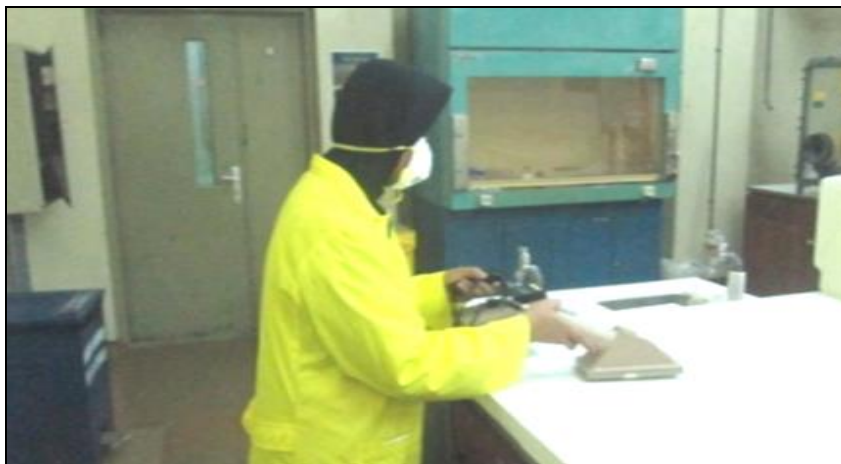
Gambar 2. Pengukuran Kontaminasi meja

Pengukuran tingkat kontaminasi dilakukan oleh petugas keselamatan (Gambar 2) dan didampingi oleh petugas proteksi radiasi (PPR).