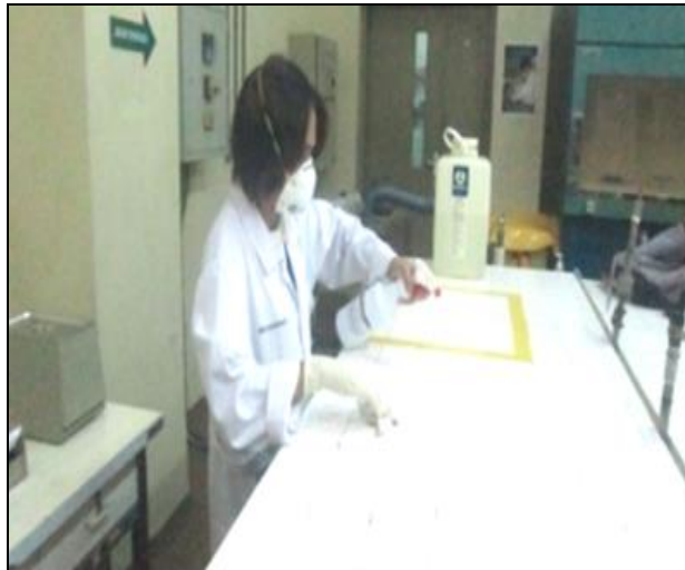
Gambar 4. Dekontaminasi meja

diawasi oleh petugas keselamatan dan petugas proteksi radiasi (PPR). Hasil kegiatan dekontaminasi ditunjukkan pada Tabel 3.