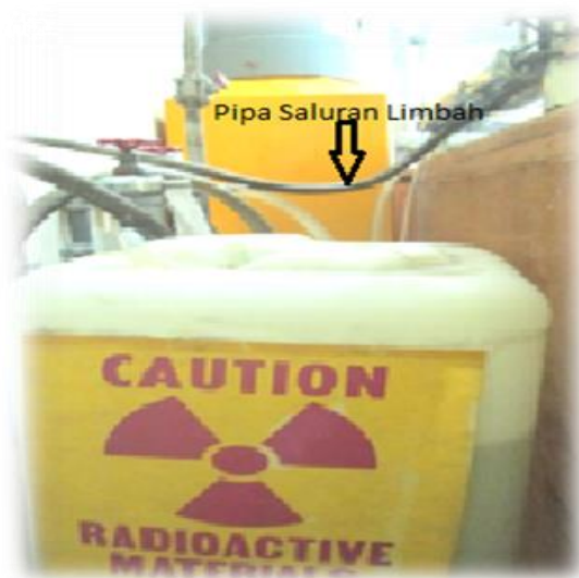
Gambar 6. Wadah limbah cair

Pada limbah cair hasil metalografi ini tidak dilakukan pengukuran kontaminasinya. Namun hanya ditampung pada wadah limbah cair (Gambar 6).