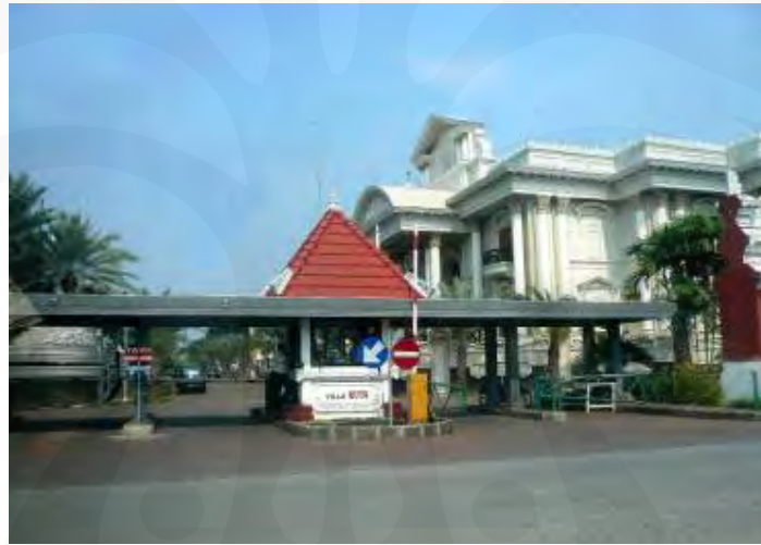
Gambar 14 Gerbang Masuk dengan Keamanan Ketat

Di Bukit Gading Villa, setiap sektornya, yaitu Villa Tampak Siring, Villa Kintamani, Villa Sanur, dan Villa Kuta memiliki gerbangnya masing-masing namun keempat-empatnya memiliki desain yang sama. Gerbang-gerbang ini tidak dirancang secara berlebihan apabila menimbang masalah keamanan. Gerbangnya bukan merupakan pagar yang tinggi yang selalu ditutup dan hanya dibuka apabila ada yang hendak keluar atau masuk. Tapi hanya berupa gerbang dengan kanopi dan portal yang dijaga oleh personil sekuriti bersiaga selama 24 jam yang tidak akan mengizinkan seseorang masuk tanpa tujuan hendak mengunjungi penghuni yang mana.