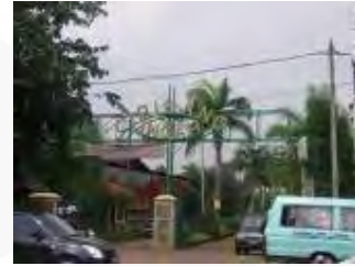
Gambar 5 Akses-akses masuk ke Cipinang Indah Real Estate