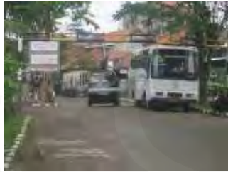
Akses Kali Malang bagian barat