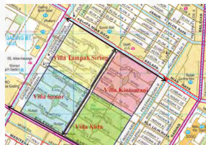
Gambar 15 Batas perimeter tiap sektor

Kawasan ini terletak di daerah yang cukup tinggi aktifitas komersialnya karena dekat dengan Sports Mall dan pusat perkantoran (Rukan Gading Mas dan Rukan Gading Bukit Indah) sehingga jalan raya yang ada di sisi utara dan selatan kawasan ini