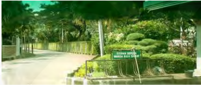
Gambar 16 Batas pagar dengan perdu (difoto dari arah dalam sektor)

menjadi jalan yang ramai diakses, hal ini sebenarnya menguntungkan pada satu sisi karena kemudahan dalam mencapai pusat komersil itu menjadi semakin dekat namun kemudian dapat menjadi faktor kecemasan yang memicu rasa takut akan adanya kriminalitas dari orang asing yang mengakses jalan tersebut. Namun apabila dikaitkan dengan ketakutan akan pencitraan status sosial yang dihadapi oleh sebagian masyarakat, hal tersebut tentu akan mengurangi tingkat eksklusifitas kawasan hunian ini, oleh karena itu diadakanlah batas-batas pada perimeter tiap-tiap sektor, batas itu memisahkan area-area ini dengan beberapa cluster house lainnya seperti Gading Batavia di sisi barat dan Janur Indah di sisi kiri. Batas tersebut pada sisi yang berbatasan langsung dengan hunian lainnya berupa dinding tinggi setinggi 4 meter,