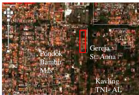
Gambar 27 Peta Udara Lokasi

Gereja Khatolik Santa Anna, Jl. Duren Sawit, Jakarta Timur adalah salah satu