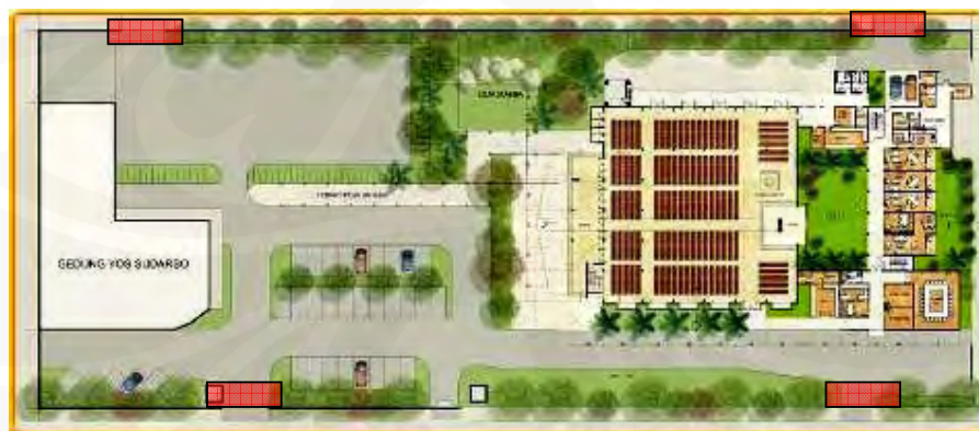
Gambar 29 Site Plan Gereja Santa Anna, Duren Sawit

Setelah kejadian tersebut hingga saat ini pihak gereja masih sering merasa was-was tiap ada orang asing yang berkeliaran di sekitar gereja dengan aktivitas mencurigakan. Penulis sempat diperhatikan cukup lama oleh salah satu penjaga saat sedang mengambil gambar tampak muka bangunan tersebut. Hal ini disebabkan karena pada beberapa saat sebelum peristiwa pemboman itu, seorang jemaat yang akan memasuki aula untuk mengikuti misa sempat melihat seorang pria duduk di kursi dekat pintu masuk dengan membawa sebuah kantong plastik hitam yang kemudian berdasarkan penyelidikan pihak yang berwajib terbukti sebagai bahan bom yang dibawa masuk oleh sang pelaku.