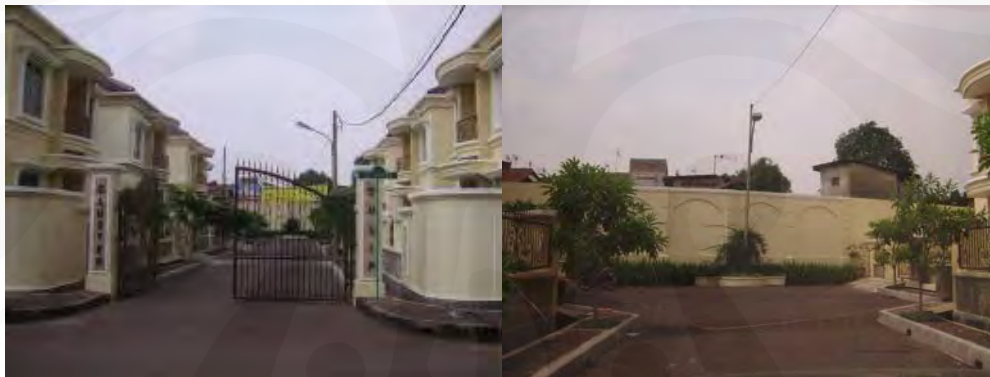
Gambar 8 Cluster Tulip: Sistem Cluster di dalam Real Estate

Hal-hal pengantisipasi di atas dilakukan karena adanya ketakutan yang dirasakan oleh warga Cipinang Indah yang telah lama tinggal di lingkungan ini