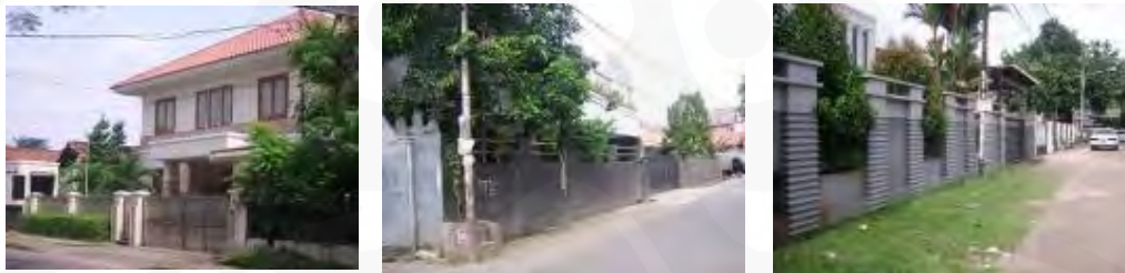
Gambar 25 Rumah-rumah di tepi jalan Tebet Timur Raya

Di Tebet Timur ini baik pada model rumah yang berada di jalan raya maupun di jalan-jalan kecil, ke semuanya melakukan hal yang sama pada batas rumah mereka dengan jalan, yaitu dengan membangun pagar-pagar tinggi yang membatasi area rumah dengan jalan di depannya sehingga tidak bisa dimasuki ataupun dipanjat oleh orang tidak dikenal atau bahkan pencuri ketika tidak ada yang memperhatikan atau ketika jalanan sedang sepi.