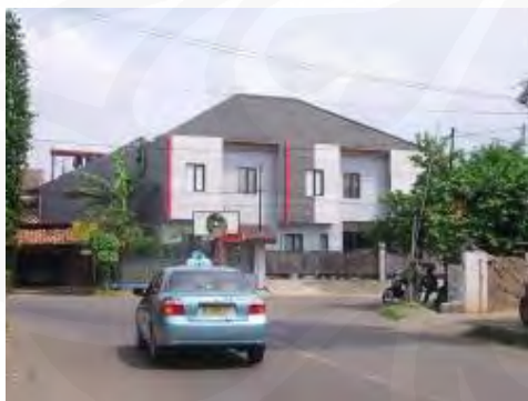
Gambar 21 Rumah bervolume besar di Jalan Tebet Timur Raya

Tebet menjadi ramai, karena lokasinya yang bisa menjadi jalan tembus dari dan menuju beberapa tempat seperti Pancoran, Mampang, Manggarai, Kampung Melayu, dll. Model permukiman di kawasan Tebet ini, khususnya Tebet Timur, yang penulis amati, merupakan kavling-kavling kecil dengan desain rumah yang telah banyak mengalami perubahan