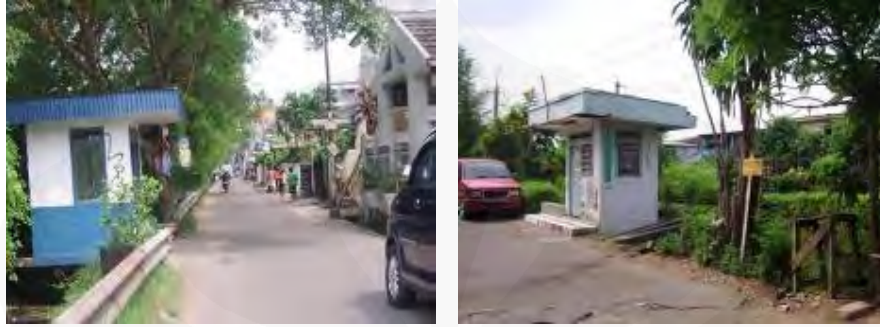
Gambar 24 Pos-Pos Ronda

Warga Tebet Timur rata-rata berada pada tingkatan status sosial dan kelas ekonomi menengah hingga atas dan umumnya bekerja dengan jadwal kerja pergi pada pagi hari dan pulang ketika sudah menjelang malam. Berdasarkan beberapa wawancara dengan warga, didapatkan informasi memang sangat jarang bahkan hampir tidak pernah ada interaksi antara sesama tetangga meskipun beberapa di antaranya sudah tinggal di sana dalam kurun waktu yang cukup lama, apalagi ditambah dengan kedatangan pembeli-pembeli rumah baru yang merenovasi rumah dan tinggal di daerah ini, bisa dikatakan tidak memiliki kontak sama sekali dengan tetangga sekitar.