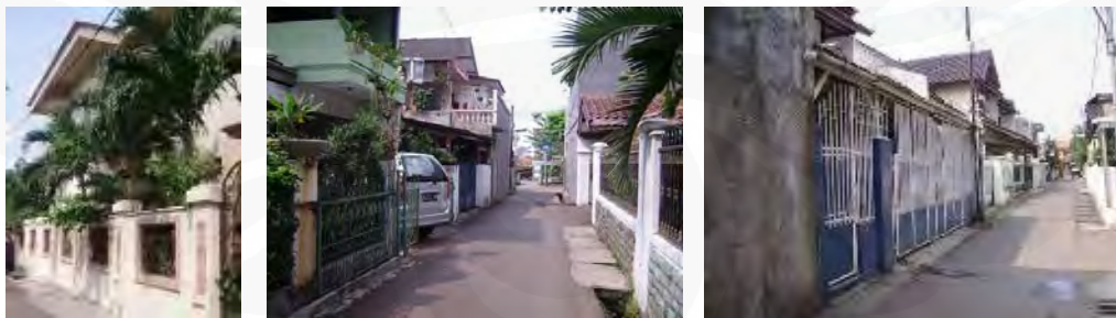
Gambar 26 Rumah-rumah di jalan-jalan kecil Tebet Timur Dalam VII-VIII