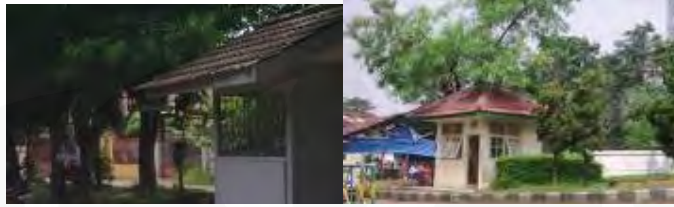
Gambar 7 Pos-pos pada lingkungan Cipinang Indah