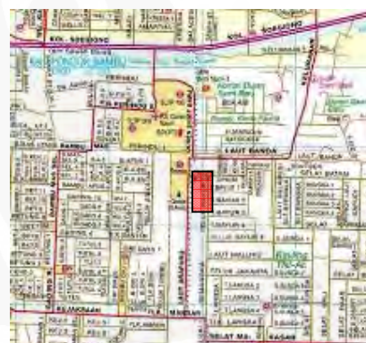
Gambar 28 Lokasi Gereja St. Anna