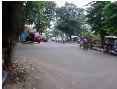
Gambar 22 Lingkungan di Jalan Tebet Timur Raya