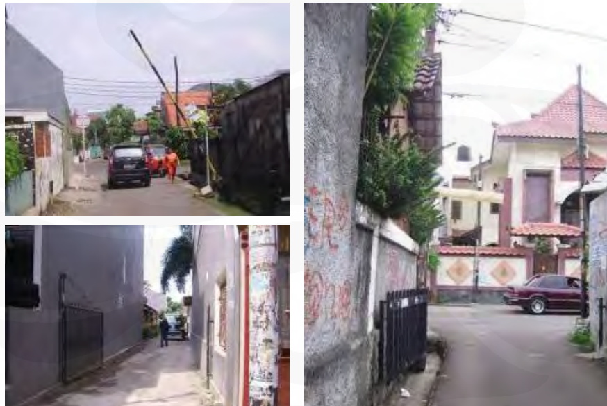
Gambar 23 Portal-portal yang ditutup pada malam hari

Karena kawasan pemukiman ini bukan berupa sistem cluster house atau real estate yang memiliki pengembang yang mengelola sistem-sistem yang berjalan di dalamnya, maka masyarakat secara bersama-sama harus melakukannya untuk kepentingan mereka, seperti masalah kebersihan dan keamanan. Untuk hal keamanan, daerah yang bebas diakses oleh orang meskipun bukan warga sekalipun ini memiliki cara sendiri dalam mengantisipasi tindakan-tindakan kriminalitas yang lumayan sering terjadi, misalnya dengan memasang portal di ujung jalan yang akan ditutup pada malam hari serta mengadakan sistem ronda dengan para satpam yang diupahi untuk menunggu gardu-gardu yang terdapat hampir di setiap ujung gang.