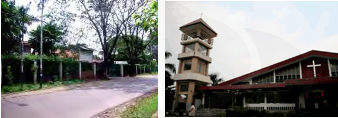
Gambar 31 Tampak Depan Gereja Santa Anna, Duren Sawit, Jakarta

Sejauh ini masyarakat sekitar tidak merasa terganggu dengan keberadaan gereja ini, karena memang lokasinya tidak begitu dekat dengan daerah permukiman. Hanya pada waktu-waktu tertentu di mana kegiatan peribadatan besar sedang dilaksanakan akses masuk menuju perumahan melalui jalan Laut Arafuru mengalami kemacetan karena banyak mobil jemaat yang parkir hingga ke tepi jalan.