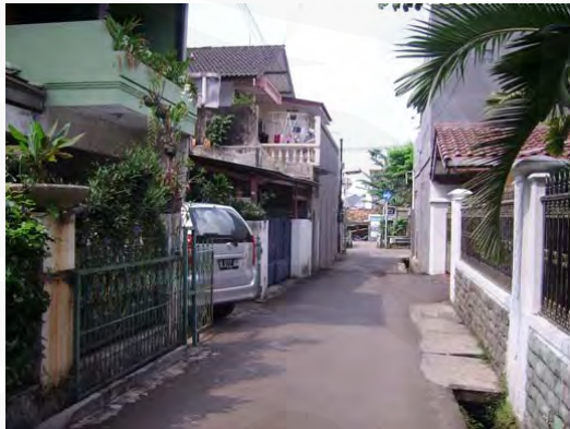
Gambar 20 Lingkungan hunian Tebet

ini dipindahkan ke daerah Tebet. Kemudian Tebet direncanakan dengan baik sebagai tempat pemukiman baru yang dengan pembagian atas banyak kavling, tersedia fasilitas umum dan terdapat banyak taman, jalan raya dan penunjang lainnya. Saat ini daerah Tebet merupakan daerah hunian yang sangat diminati oleh masyarakat baik untuk tempat bertinggal, membuka usaha, bersekolah, dan lain-lain karena lokasinya yang sangat strategis di tengah kota Jakarta dengan akses yang mudah ke berbagai bagian kota Jakarta.