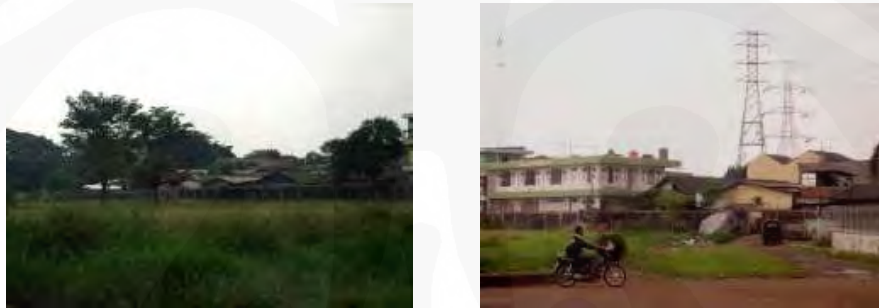
Gambar 9 Dinding Pembatas Cipinang Indah dengan Perumahan di Sekitar

Sehingga pada pembangunan dinding pembatas di sebelah barat, yaitu daerah pengembangan Cipinang Indah II dengan daerah permukiman warga yang ada disebelahnya dibuat masif dan tinggi terbuat dari batako sebagai akses. Area Cluster Tulip yang terletak di bagian paling barat dari daerah perumahan Cipinang Indah ini juga berbatasan langsung dengan permukiman daerah Pondok Bambu sehingga dibangunlah dinding-dinding yang tinggi.