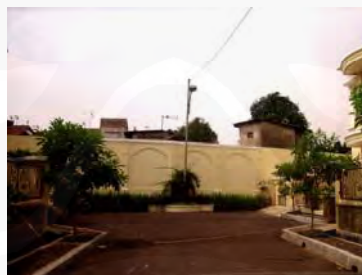
Gambar 10 Dinding barat Cluster Tulip