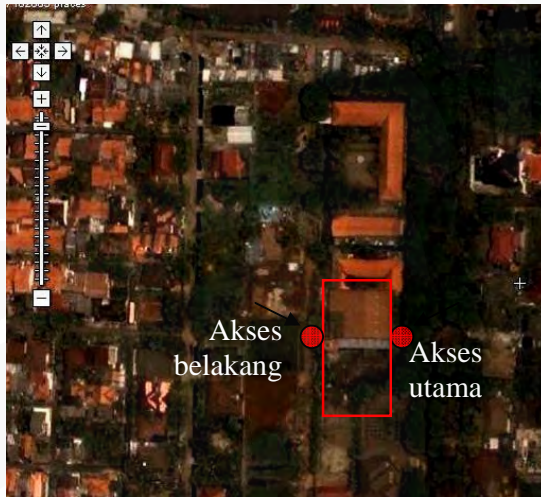
Gambar 30 Foto Udara Gereja St. Anna

Pada desain renovasinya, perancang membangun pagar ke arah jalan Laut Arafuru yang terdapat pintu masuk utama. Pagar ini memiliki tinggi kurang lebih 2,3 meter. Dengan keadaan pagar pintu masuk utama yang selalu tertutup apabila tidak terdapat kegiatan. Akses masuk yang direncanakan pada rencana tapak sebenarnya terdapat empat buah, yaitu dua di bagian depan (Jalan Laut Arafuru) dan dua di bagian belakang (masuk dari jalan Teluk Mandar) namun sekarang aksesnya hanya ada dua satu di bagian depan untuk umum dan satu di belakang untuk pengurus paroki. Akses jalan ini berupa jalan kecil yang tidak biasa dilewati umum.