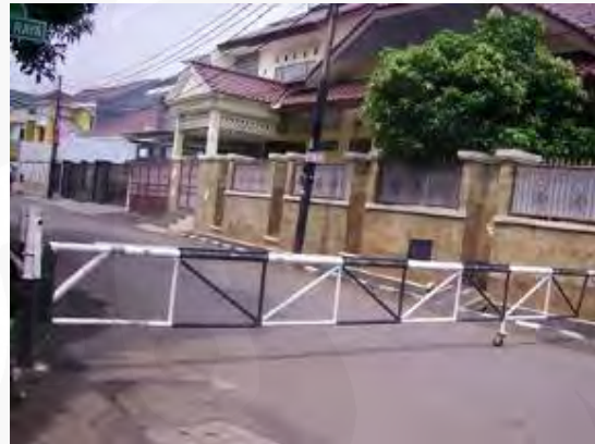
Gambar 6 Sistem pemortalan pada waktu-waktu tertentu di Cipinang Indah

Perumahan ini melakukan beberapa hal sekaligus untuk menangani masalah keamanan dari tindakan kriminalitas yang acap kali dialami oleh penghuninya, seperti memasang portal pada siang hari di setiap ujung jalan, dan hanya akan dibuka oleh personil sekuriti pada pagi hari di jam-jam berangkat ke kantor dan sekolah, yaitu pukul enam hingga pukul delapan dan pada sore hari pukul empat hingga pukul enam. Selebihnya maka portal akan ditutup dan dikunci sehingga apabila ingin masuk ke jalan itu, mobil perlu memutar beberapa blok untuk sampai ke rumah yang dituju.