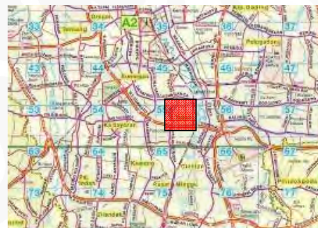
Gambar 19 Lokasi Tebet di Kota Jakarta

Tebet merupakan sebuah kawasan permukiman yang telah ada sejak pembangunan Gedung Ganefo pada tahun 1960 yang disiapkan pemerintah sebagai tandingan Olimpiade. Gedung Olahraga dan Perkampungan Atlit ini dibangun di daerah Senayan, pada saat itulah penduduk daerah