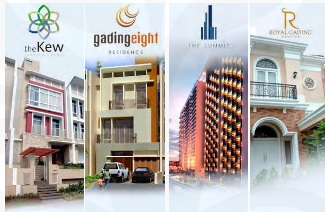
Gambar 1 Gambar-gambar produk hunian yang menawarkan prestise

itulah, pada kehidupan kota dan gaya hidup metropolis, impresi akan status sosial menjadi sebuah ketakutan tersendiri karena hal tersebut merupakan sesuatu yang dipandang penting dalam berkehidupan sosial di kota. Adapun hal-hal yang dianggap sebagai pembentuk dari impresi terhadap status sosial adalah kemakmuran, investasi, pekerjaan, kepemilikan rumah dan kendaraan pribadi 20 .