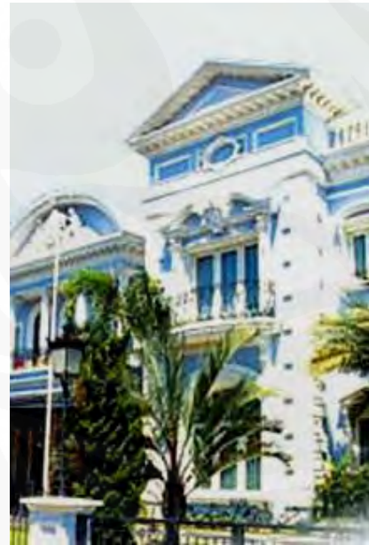
Gambar 17 Salah satu unit di Bukit Gading Villa

Bukit Gading Villa menawarkan sebuah hunian yang tidak hanya nyaman ditinggali namun juga sebuah gaya hidup yang elegan dan berkelas. Rumah-rumah disini dirancang bergaya klasik dikombinasikan dengan arsitektur modern. Kini setelah semua unit habis dipasarkan, setiap unit dapat merubah gaya dari fasad dan gaya arsitektur sesuai dengan yang diinginkan oleh penghuninya. Sehingga, citra akan status sosial akan semakin terasa jelas di sini di mana setiap penghuni bebas mengaktualisasikan selera dan cita rasanya pada gaya dan citra dari rumahnya yang merepresentasikan citra diri dari kelas sosial dan tingkat ekonomi atas.