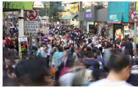
Gambar 2 Anonimitas pada kerumunan di ruang kota

Anonimitas memiliki arti tanpa nama atau tiada bernama, secara bahasa kata ini biasanya merujuk kepada seseorang dan berarti bahwa identitas personal atau informasi tentang personal orang tersebut tidak diketahui 21 . Salah satu sifat dari ruang publik di kota adalah adanya tingkat anonimitas yang tinggi, dimana orang-orang dalam massa yang besar berada dalam satu tempat namun tidak saling mengenal satu sama lain. Hal ini pun disampaikan oleh Georg Simmel dalam salah satu esai klasiknya pada 1903, The