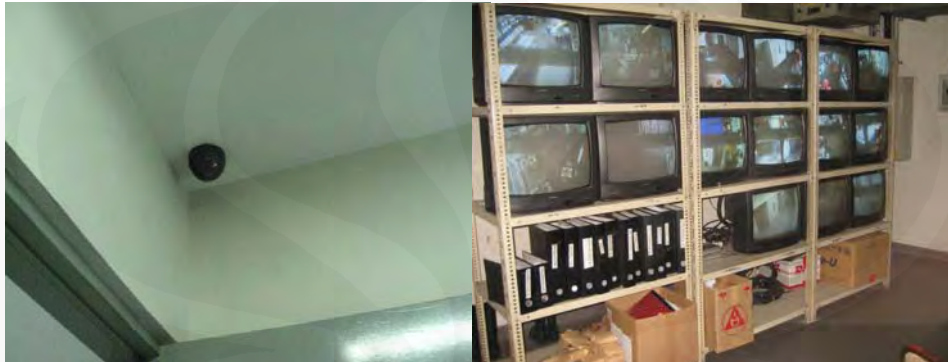
Gambar 3 Kamera CCTV dan monitor pengawas di Plaza BII 2 Jakarta

interior, transmisi suara dan telepon digital, detektor infra merah dan lain sebagainya telah banyak ditemui di berbagai tempat baik sifatnya publik maupun privat 42 .