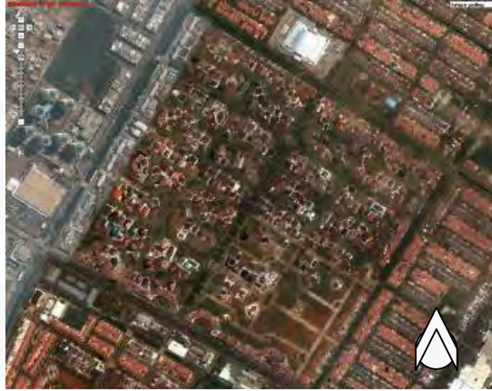
Gambar 12 Peta Udara Lokasi

Bukit Gading Villa merupakan sebuah hunian eksklusif yang dibangun khusus untuk memenuhi keinginan kalangan masyarakat ini dengan mengusung jargon Simbol Sukses Pribadi Mapan . Hunian ini dibangun di lokasi prestisius Summarecon Kelapa Gading berlokasi di jalan Boulevard Barat Kelapa Gading yang mempunyai akses langsung ke Jalan Boulevard Raya dan sangat dekat dengan Mall Kelapa Gading, menjadikannya sebuah lokasi yang sangat strategis. Aksesnya yang sangat mudah ke pusat hiburan di Jakarta Utara, seperti Mal Kelapa Gading, La Piazza maupun Gading Food City yang dapat ditempuh dalam hitungan beberapa menit saja menjadi keunggulan tersendiri dari hunian ini karena fasilitas-fasilitas tersebut menunjang gaya hidup masyarakat yang menyukai ‘rendezvous’ di kafe-kafe, sekedar bermain bowling atau billiard bersama teman usai jam kerja.