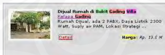
Gambar 13 Iklan Jual Rumah

Komunitas yang tinggal di hunian ini termasuk masyarakat yang termasuk golongan dengan status sosial dan tingkat ekonomi kelas atas. Hal ini dapat dilihat dari besarnya kavling tiap rumah dan berdasarkan hasil pengamatan, didapati bahwa setiap keluarga rata-rata memiliki mobil lebih dari dua. Selain itu, harga per unit rumah di lingkungan ini rata-rata berkisar di atas 10 M. Seperti yang diinformasikan oleh iklan jual beli rumah di internet berikut ini.