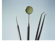
Instrumen (alat) kedokteran gigi