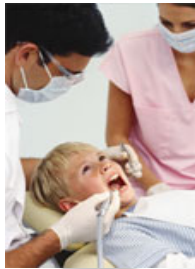
Dokter gigi mengebor