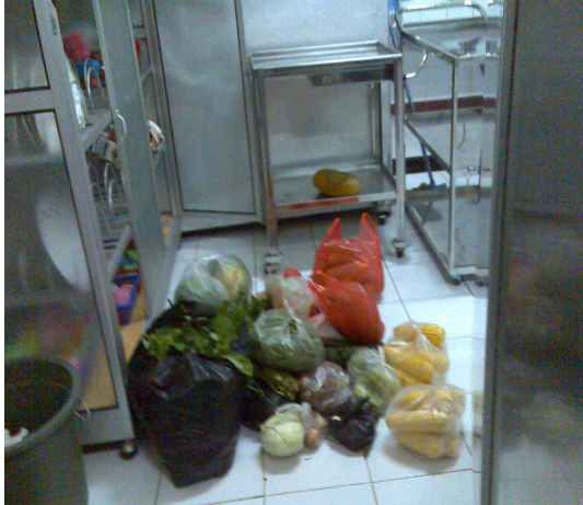
FOTO PENELITIAN DI UNIT GIZI RSUD KOTA DEPOK TAHUN 2009