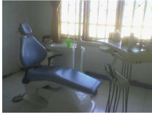
Gambar 13. Puskesmas Peusangan