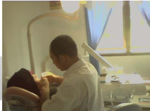
Gambar 14. Puskesmas Ulee Jalan