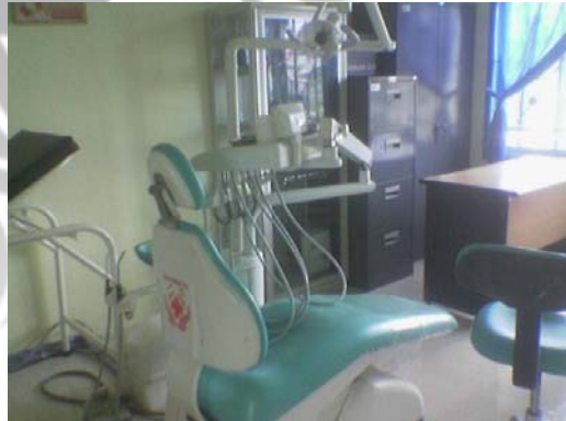
Gambar 21. Puskesmas Plimbang