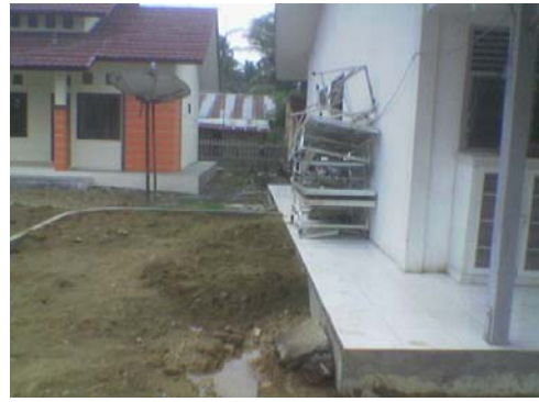
Gambar 7. Puskesmas Jeunib