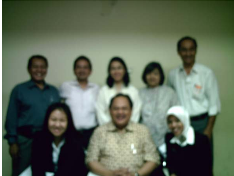
Foto penulis (depan kanan) bersama dosen pembimbing, dosen penguji, serta rekan ujian skripsi