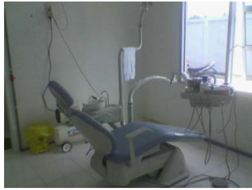
Gambar10. Puskesmas Jeumpa