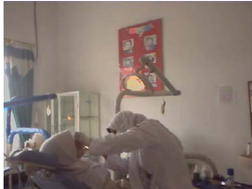
Gambar 19. Puskesmas Gandapura