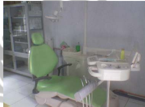
Gambar 6. Puskesmas Simpang Mamplam