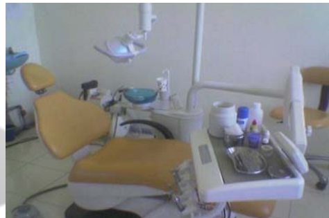
Gambar 11. Puskesmas Kota Juang