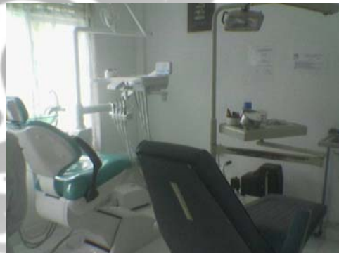
Gambar 12. Puskesmas Juli