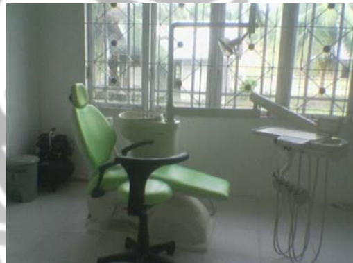
Gambar 18. Puskesmas Lueng Daneuen