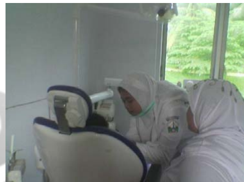
Gambar 17. Puskesmas Kuta Blang