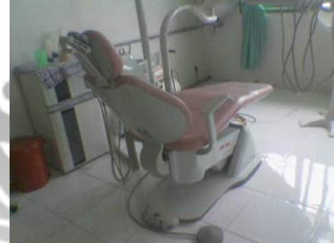
Gambar 15. Puskesmas Jangka