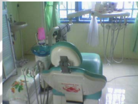
Gambar 20. Puskesmas Kuala