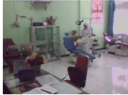
Gambar 4. BLU RS Daerah dr. Fauziah