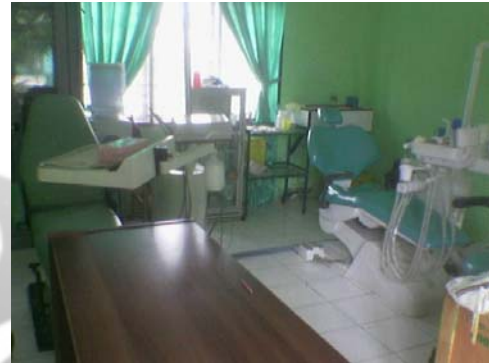
Gambar 5. Puskesmas Samalanga