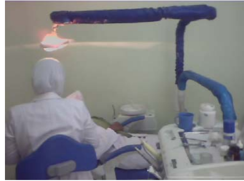
Gambar 16. Puskesmas Makmur