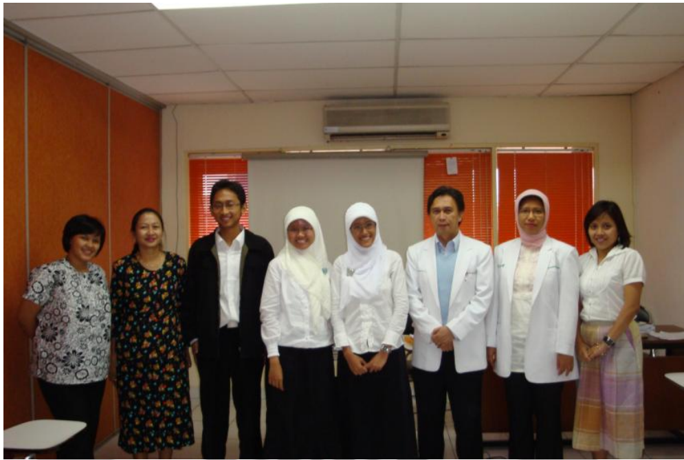
Foto bersama tim karil, pembimbing, dan penguji