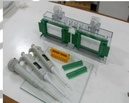
Pipet dan SDS-PAGE Apparatus