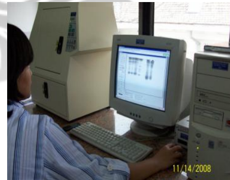
Perangkat Gel Doc