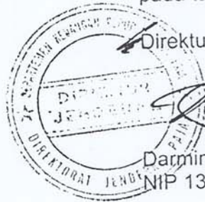
Darmin Nasution NIP 130605098