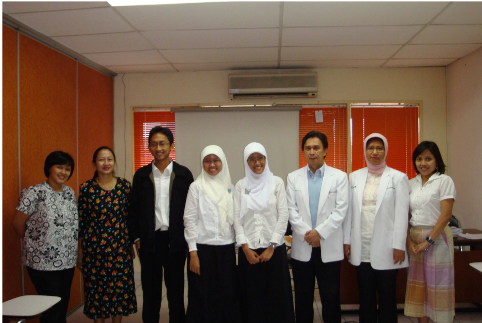
Foto bersama tim karil, pembimbing, dan penguji