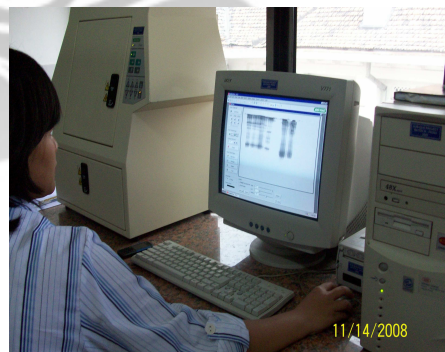
Perangkat Gel Doc