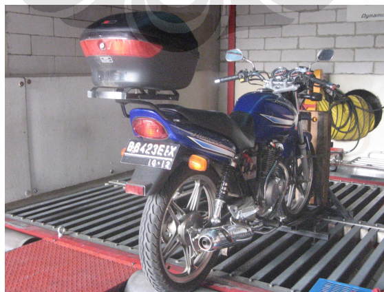
Gambar 3.6 Pengikatan Motor Dan Penempatan Diatas Roller