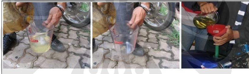
Gambar 3.11 Pengukuran konsumsi bahan bakar bensin

Hasil dari pengujian yang dilakukan adalah data konsumsi bahan bakar minyak, konsumsi gas, jarak tempuh dan waktu tempuh untuk setiap set putaran. Data-data yang diambil merupakan data untuk setiap variasi venturi mixer dan variasi bukaan katup gas.