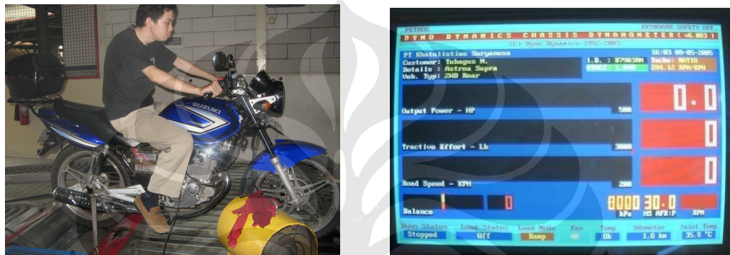
Gambar 3.8 Proses Pengambilan Data Dengan Dynamometer