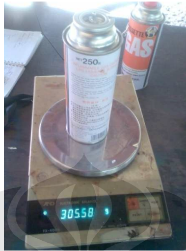
Gambar 3.10 Pengukuran Massa Gas

Prosedur pengambilan data konsumsi bahan bakar pada penelitian ini merujuk pada SNI 09-4405-1997 tentang Cara uji unjuk kerja jalan sepeda motor: