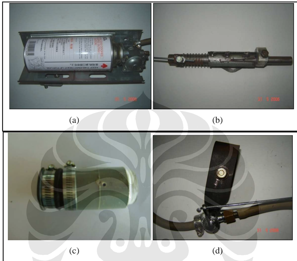
Gambar 3.2. (a) Kompor Gas Portabel, (b) Mekanisme, (c) Venturi Mixer dan (d) Katup Penghubung

Venturi mixer : bagian ini berfungsi untuk mencampur udara dan LPG