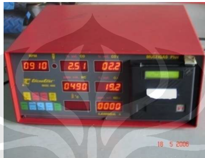
Gambar 3.7 Gas Analyzer