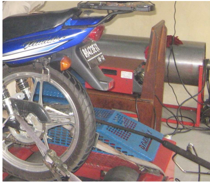
Gambar 3.9 Proses Pengambilan Data Emisi

Pengambilan data dengan mengisi tabel pada lembar pengambilan data.