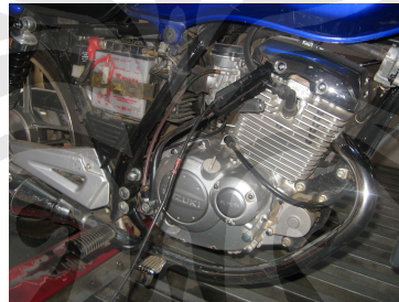
Gambar 3.5 Alat Pengukur RPM Mesin