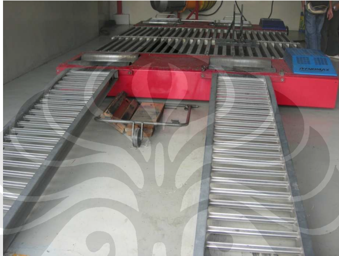
Gambar 3.3 Lowboy Chassis AWD

Perhitungan-perhitungan yang dapat dihasilkan antara lain