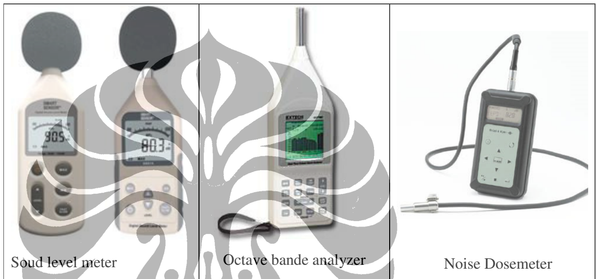
Gambar 2.1 Jenis – jenis alat ukur kebisingan

Untuk keperluan analisa distribusi kebisingan, biasanya digunakan tape recorder yang hasil rekamannya akan dibawa ke laboratorium untuk dianalisa dengan menggunakan octave band analyser dan data yang diperoleh akan menghasilkan distribusi statistik dengan menggunakan statistical distribution analyser .