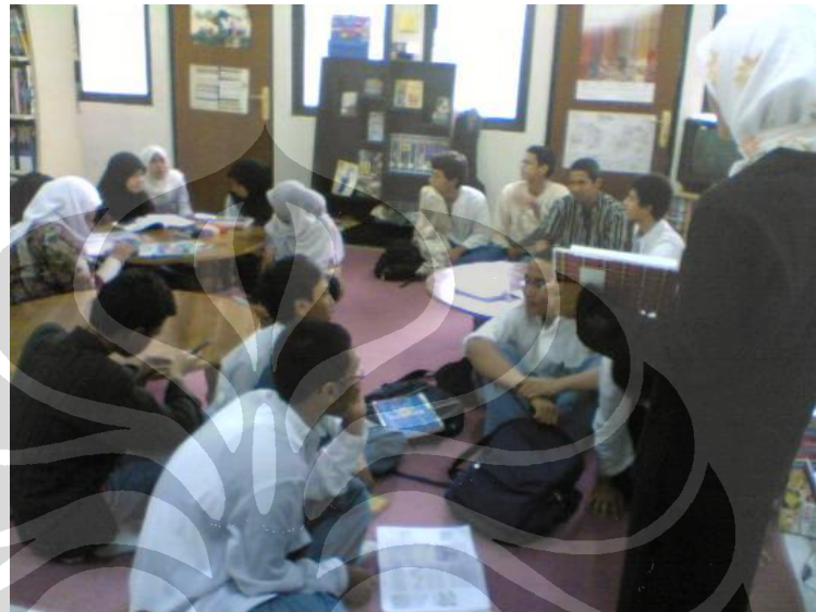
FOTO KEGIATAN BELAJAR BERSAMA DI PERPUSTAKAAN SMA LAZUARDI GIS