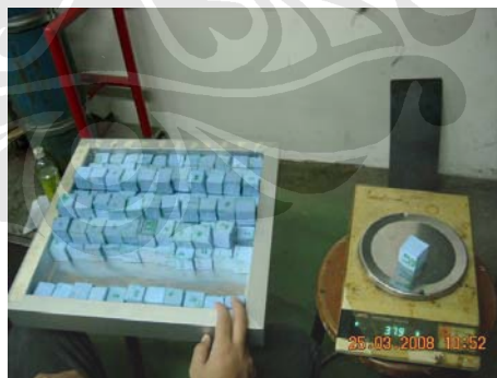
Gambar 3.7 Timbangan dan Busa

Untuk mendapatkan data fluks density dari water mist ini digunakan busa dan tempat busa yang berukuran 40 cm x 40 cm. Busa dibagi menjadi 11 x 11. Penggunaan alat ini juga untuk mengetahui persebaran spray yang dihasilkan nosel. Persebaran ini salah satu karakteristik water mist yang penting bagi proses pemadaman. Pengambilan data busa ini dilakukan beberapa kali, yaitu untuk tekanan 7 bar dengan tiga variasi sudut penyemprotan yaitu 30^{\circ} , 45^{\circ} , 60^{\circ} dan tiga variasi ketinggian yaitu 0, 2 dan 4 cm di atas pool fire