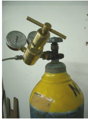
Gambar 3.2 Tabung nitrogen dan pressure regulator