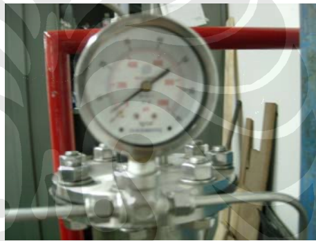
Gambar 3.6 Pressure Gauge

Alat ini untuk mengetahui tekanan air yang mengalir menuju nosel. Dengan mengetahui tekanan ini, maka dapat dijadikan variable untuk mencari karakteristik pemadaman.