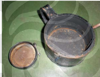
Gambar 3.1 Wadah bahan bakar d = 5 & 8 cm

Wadah bahan bakar berfungsi sebagai tempat menampung bahan bakar yang akan digunakan dalam proses pembakaran (kebakaran). Wadah yang digunakan untuk pengujian ini memiliki diameter sebesar 5 cm dan 8 cm. Sebelum melakukan pengujian dipastikan bahwa wadah ini bersih dan tidak ada kebocoran.