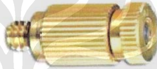
Gambar 3.4 Nosel Greenhouse

Agar dapat menghasilkan droplet air dengan ukuran yang memenuhi syarat kabut air, maka harus digunakan nosel yang sesuai dengan kebutuhan. Nosel yang akan dipakai dalam pengujian ini adalah nosel yang biasa dipakai di dalam rumah kaca (green house) untuk melembabkan dan menjaga temperatur tanaman. Nosel ini dipilih karena terutama karena alasan yang praktis, yaitu kemudahan untuk mendapatkannya, dimana nosel khusus yang digunakan untuk pemadam kebakaran yang menjadi standar di dunia tidak terdapat di pasaran Indonesia, dan harganya sangat mahal.