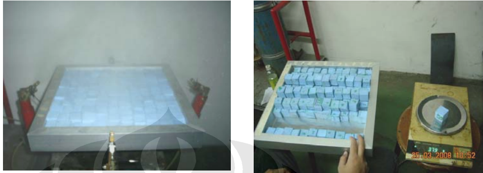
Gambar 3.8 Prosedur Pengambilan Data Fluks Density