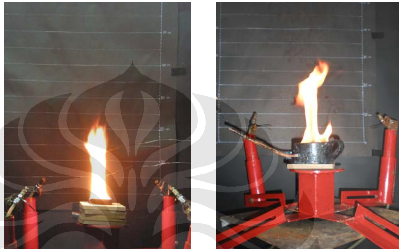
Gambar 3.9 Pengambilan Data Ketinggian Bensin