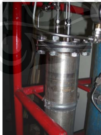
Gambar 3.3 Pressure Vessel

Pressure vessel adalah alat yang digunakan untuk mengkompresikan air menuju nosel. Alat ini bekerja berdasarkan volume control, yaitu jumlah volume gas nitrogen yang masuk ke ruang pressure vessel sama dengan jumlah volume air yang keluar menuju nosel. Untuk menjaga tekanan didalamnya masih dalam batas aman, digunakan pressure relief yang dapat diatur batas aman sampai tekanan tertentu. Saat memasukkan air bersih ke pressure vessel jangan sampai melewati batas yang telah ditentukan (batas pipa pressure relief). Hal yang perlu diperhatikan adalah air yang dimasukkan tidak ada kotoran yang dapat menyebabkan tersumbatnya nosel.