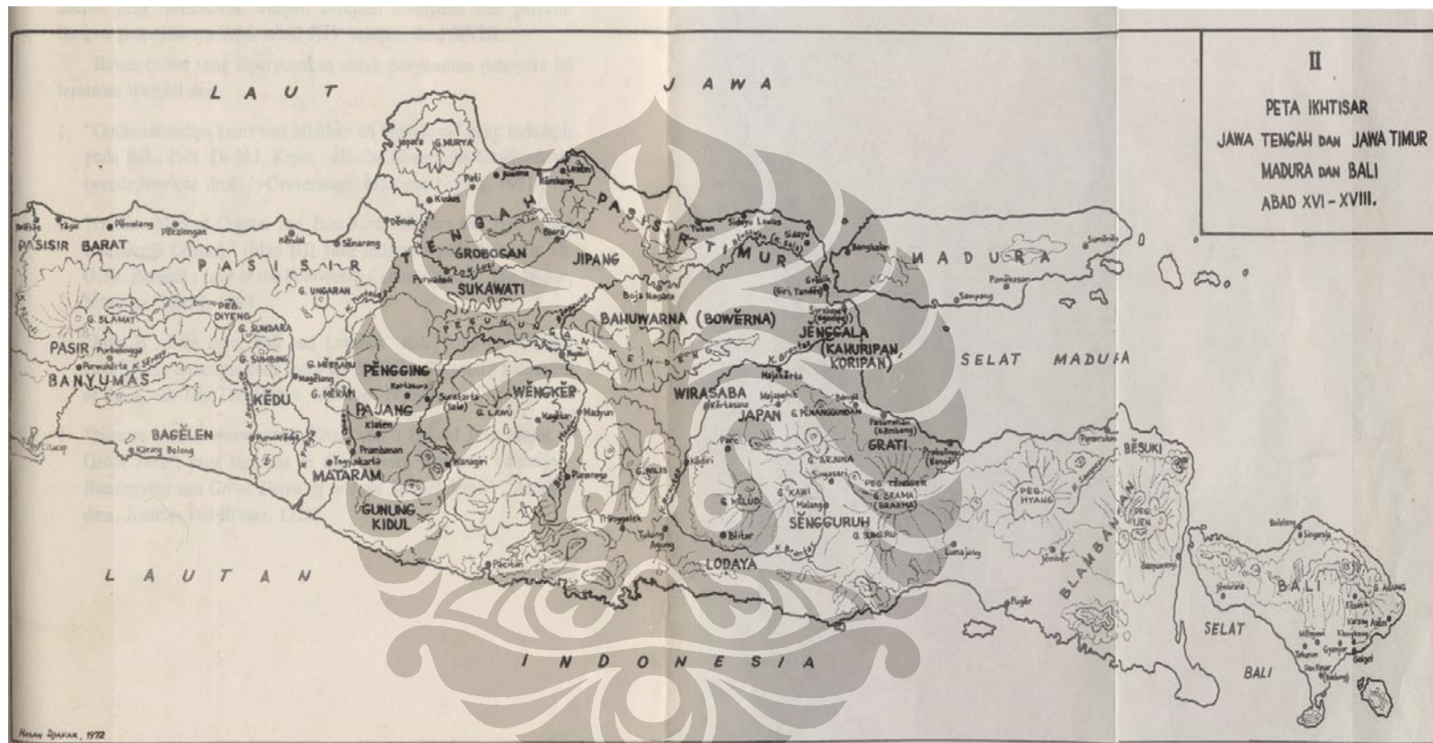
Lampiran 4. Peta Iktisar Pulau Jawa, Madura dan Bali Abad XVI-XVIII.