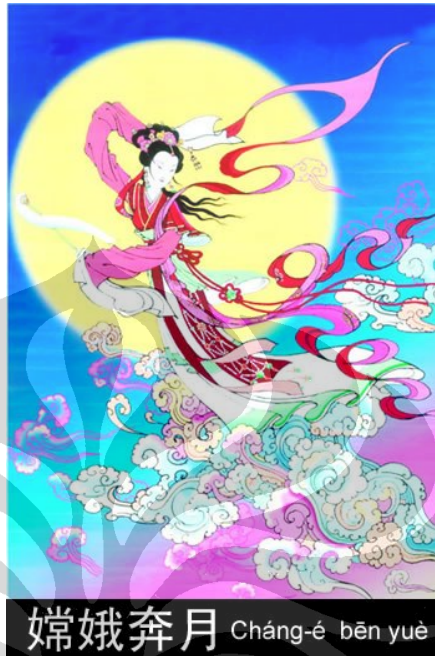
Gambar 11. Chang'E Sang Dewi Bulan