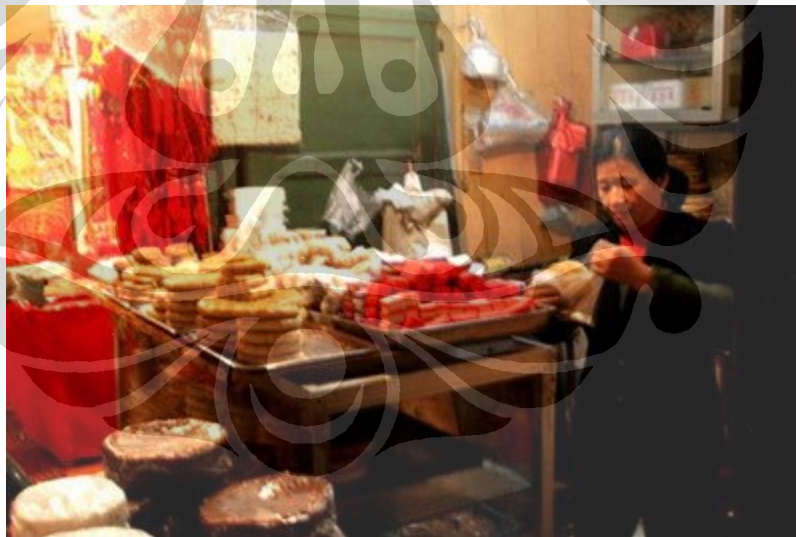
Gambar 6. Seorang wanita di Beijing melakukan pemujaan terhadap Zaoshen