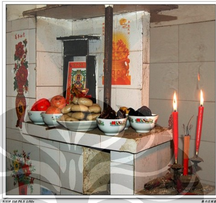
Gambar 7. Altar Zaoshen di dapur dan berbagai persembahannya