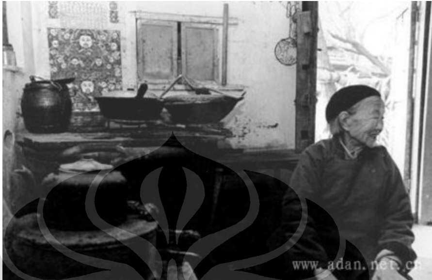
Gambar 5. Gambaran dapur keluarga Cina tradisional