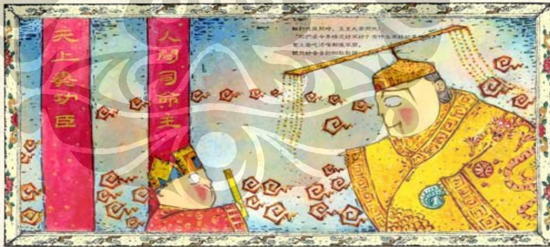
Gambar 8. Zaoshen menghadap Yuhuang dalam buku cerita anak