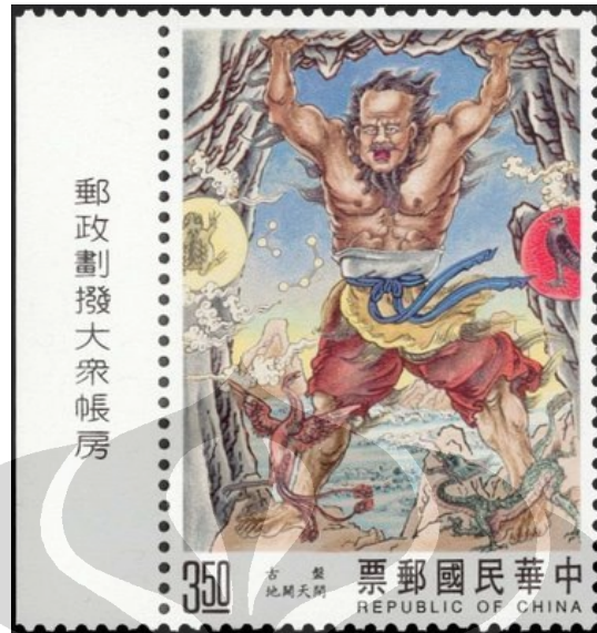
Gambar 9. Pangu dalam sebuah perangko yang dikeluarkan pemerintah RRC