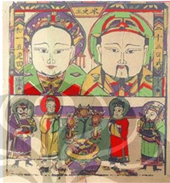
Gambar 1. Zaoshen dan Istrinya