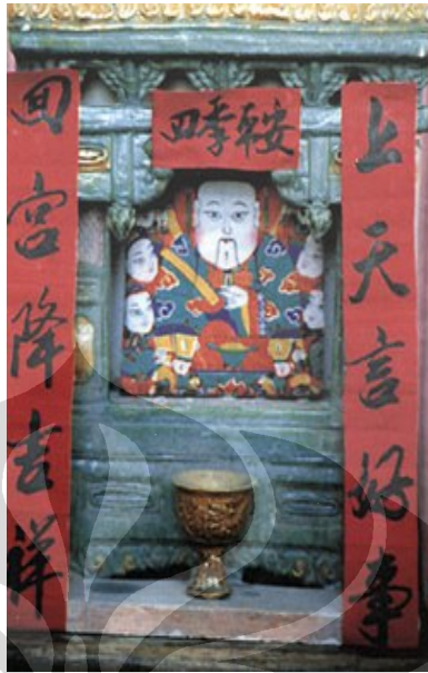
Gambar 3. Zaoshen