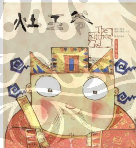
Gambar 4. Zaowangye dalam buku cerita anak