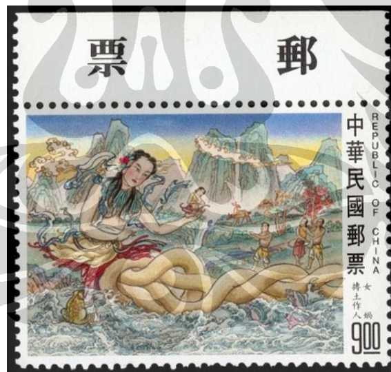
Gambar 10. Nuwa dalam sebuah perangko yang dikeluarkan pemerintah RRC