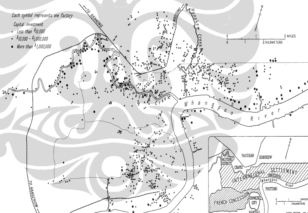
Gambar 2.1 Peta Persebaran Industri di Shanghai

Sumber: John E. Orchard "Shanghai." Geographical Review (1936). 21 April 2009 02:01 http://www.jstor.org/stable/209460 hal. 28 (telah diolah kembali)