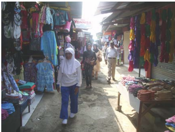
Gambar 76. Pasar Terminal Depok