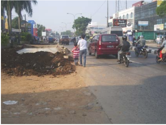
Gambar 71. Jalan Margonda Raya