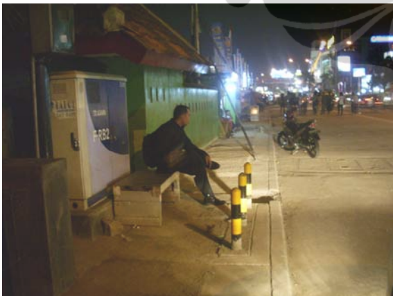
Gambar 88. Jalan Margonda Raya