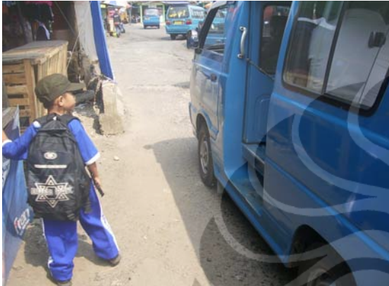
Gambar 77. Terminal Depok