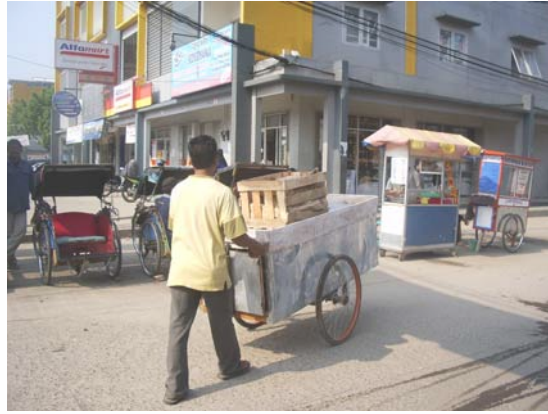
Gambar 73. Jalan menuju Stasiun Kereta Depok Lama