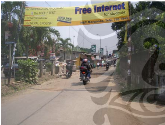
Gambar 82. Stasiun Kereta Pondok Cina