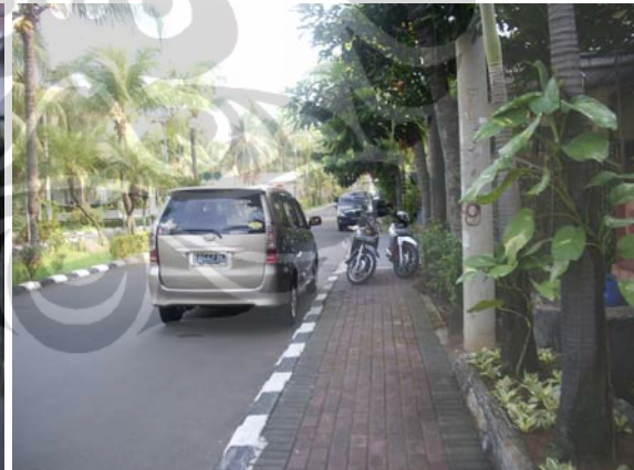
Gambar 70. Perumahan Pesona Khayangan