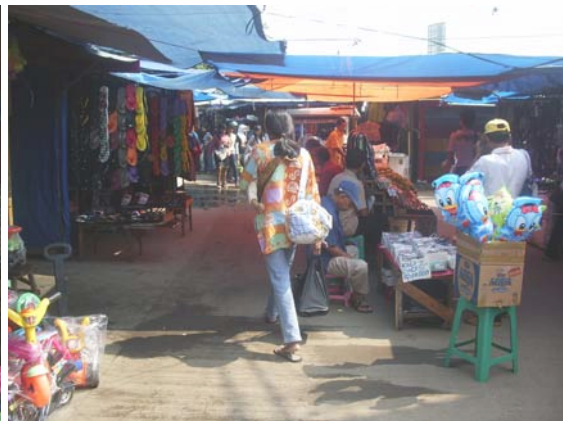
Gambar 75. Pasar Terminal Depok