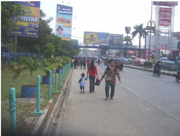
Gambar 80. Jalan Margonda Raya