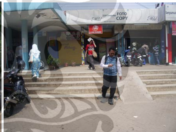
Gambar 81. Jalan Pondok Cina