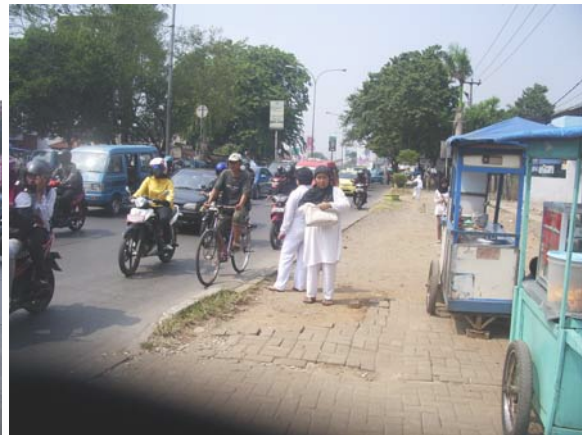
Gambar 79. Jalan Margonda Raya Sumber: Dokumentasi Pribadi 2009