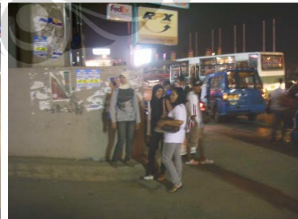
Gambar 87. Jalan Margonda Raya Sumber: Dokumentasi Pribadi 2009