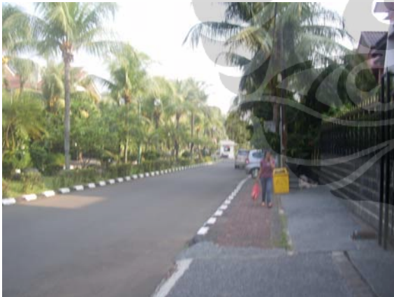
Gambar 69. Perumahan Pesona Khayangan