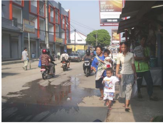
Gambar 74. Jalan menuju Stasiun Kereta Depok Lama