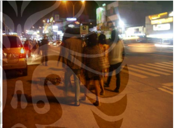
Gambar 85. Jalan Margonda Raya