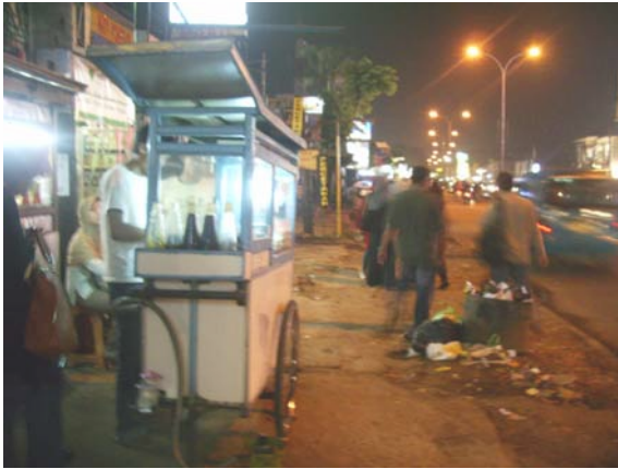
Gambar 83. Jalan Margonda Raya