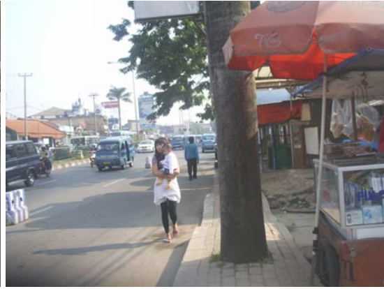
Gambar 72. Jalan Margonda Raya