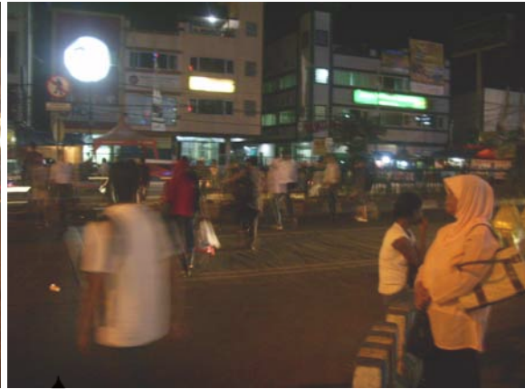
Gambar 84. Jalan Margonda Raya Sumber: Dokumentasi Pribadi 2009