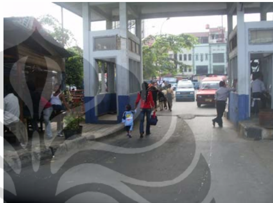
Gambar 78. Terminal Depok Sumber: Dokumentasi Pribadi 2009