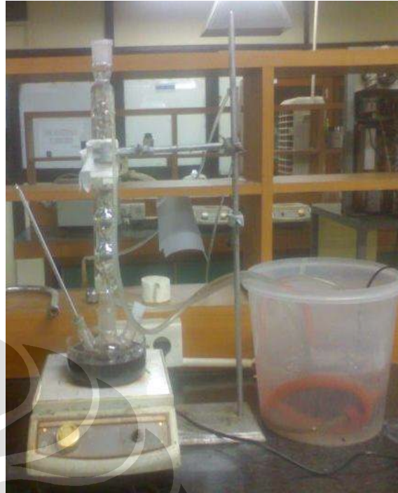
Gambar 3.1. Reaktor tunak