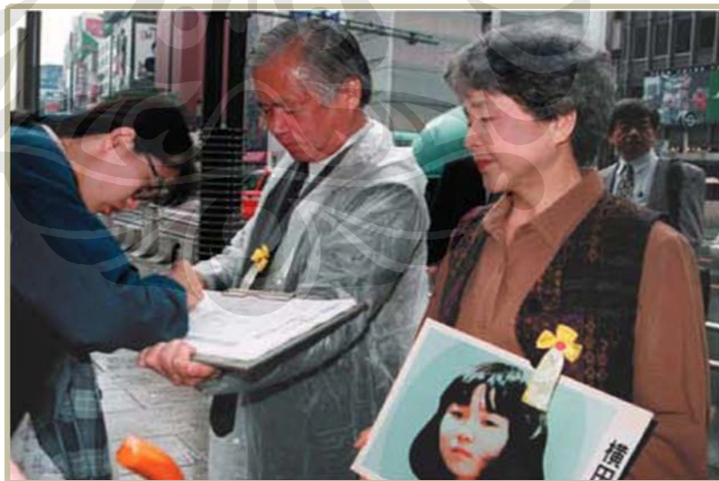
Aksi dukungan dengan mengumpulkan tanda tangan dukungan dari masyarakat.