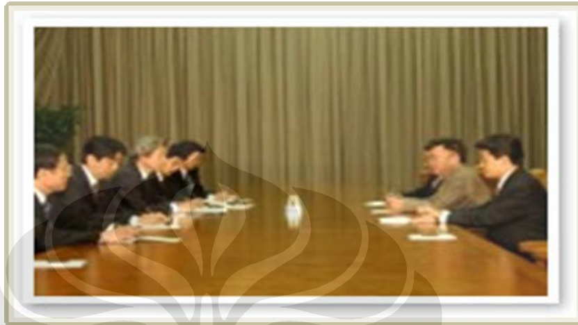
Pertemuan Jepang dan Korea Utara pada tanggal 17 September 2002.