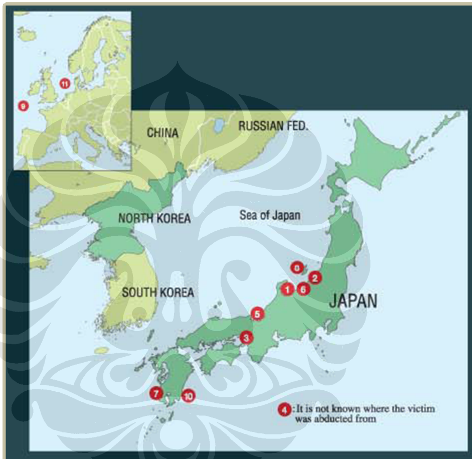
Gambar 2: Peta Lokasi Penculikan

Peta lokasi dimana penculikan terjadi. Nomor diurutkan sesuai dengan urutan terjadinya penculikan (Sesuai dengan nomor korban penculikan pada halaman 50).