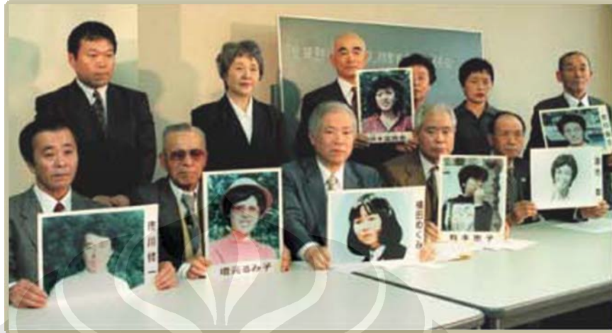
Keluarga para korban penculikan.