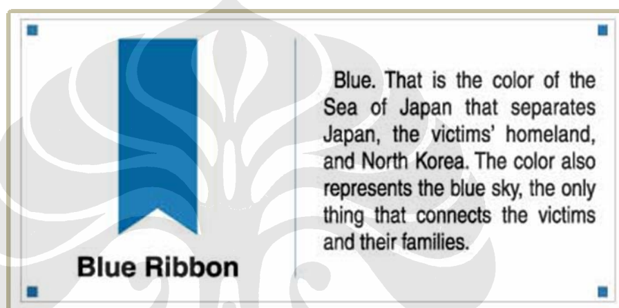
Gambar 6: Blue Ribbon

“ Blue Ribbon ” adalah lambang yang digunakan dalam kasus penculikan.