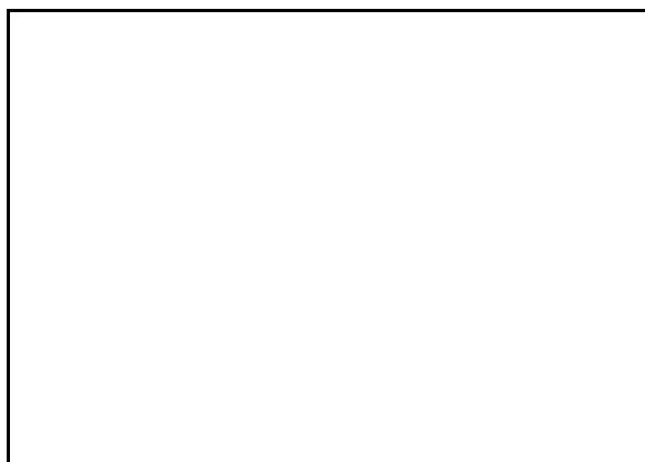
Gambar 2. Pola kenonlinieran MKTP

Gambar 1 menunjukkan bahwa sebaran data tidak berpola linier. Plot peubah produksi ikan tuna terhadap prediktor-prediktornya secara parsial, menyebabkan nilai pendugaan pada model ( F_1 ) kurang begitu berarti secara optimal. Kasus non-linier P, Sukarsa [3] telah mencoba menganalisis data ini dengan metode Aditif Terampat. Namun hasil yang diberikan kurang bagus bila dibandingkan dengan metode regresi kuadrat terkecil dengan melihat nilai R^2 terkoreksi yang dihasilkan oleh kedua metode. Dengan demikian analisis data dengan metode regresi kuadrat terkecil yang dilakukan Nurani dkk. [5] dan Generalized Additive Model yang dilakukan Sukarsa [3] tidak bagus dalam pendugaan data produksi ikan tuna.