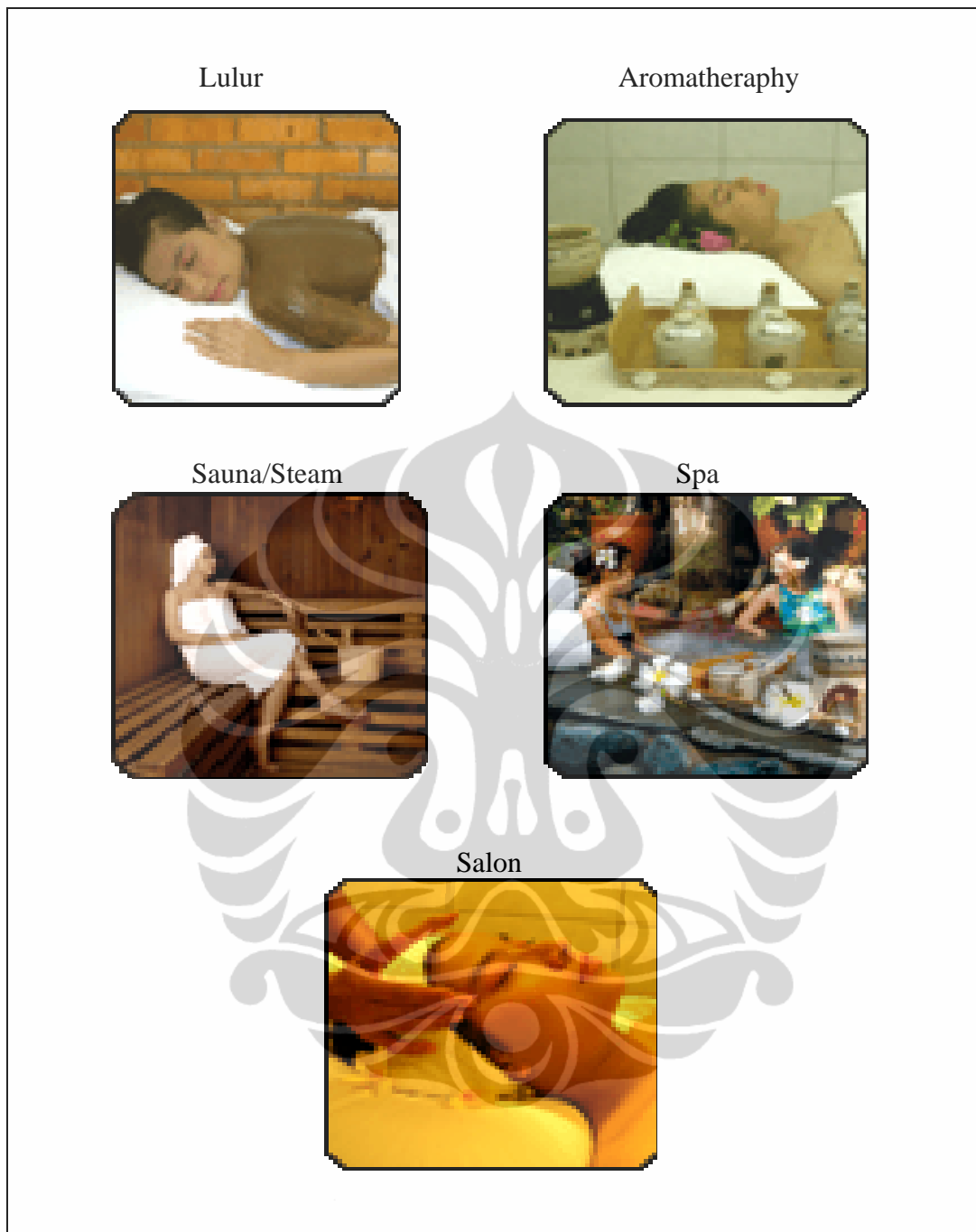
Gambar 3 Berbagai layanan yang ditawarkan oleh Griya Pijat Bersih Sehat