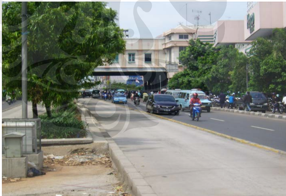
Kondisi Kepadatan Lalu Lintas dari Arah Kota Menuju Harmoni