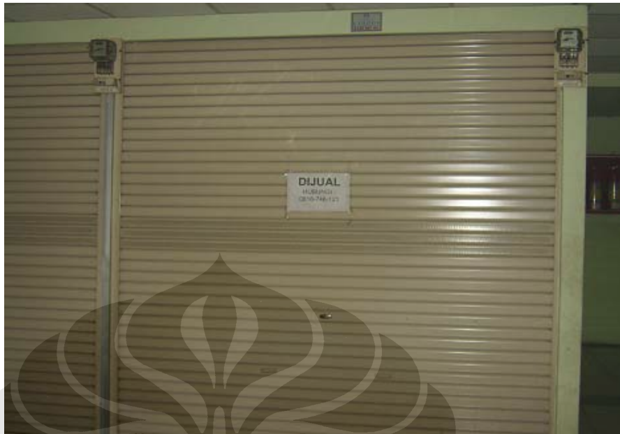
Kios-Kios Tidak Aktif dan akan dijual oleh pemiliknya