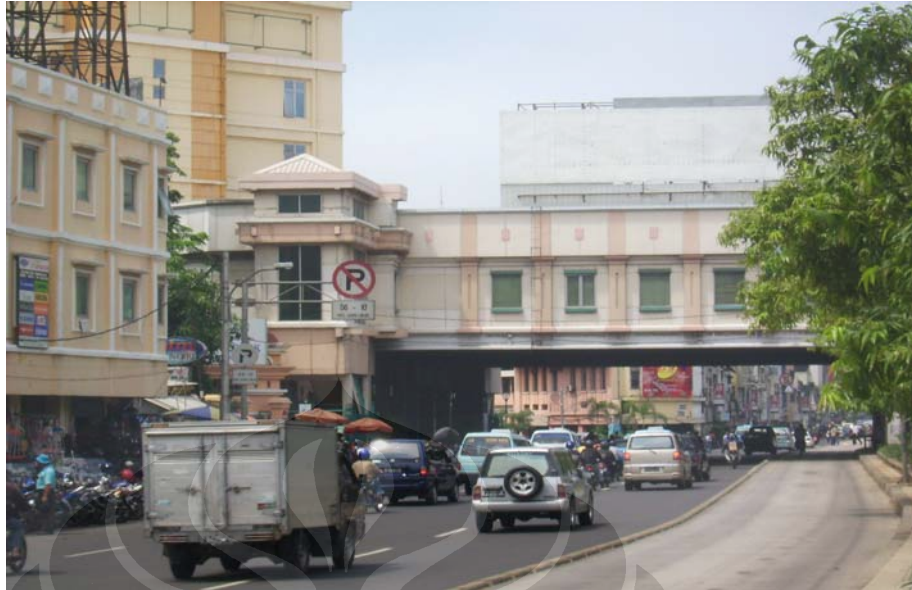
Kepadatan Lalu Lintas dari Arah Jl. Gajah Mada menuju Kota