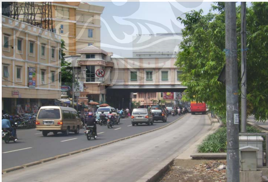
Visibilitas Pasar Glodok terhalang Jembatan Millennium