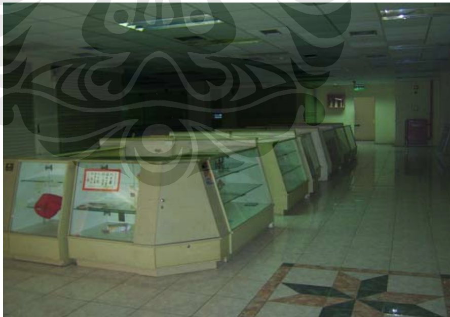
Counter Tidak Aktif dan akan dijual oleh pemiliknya