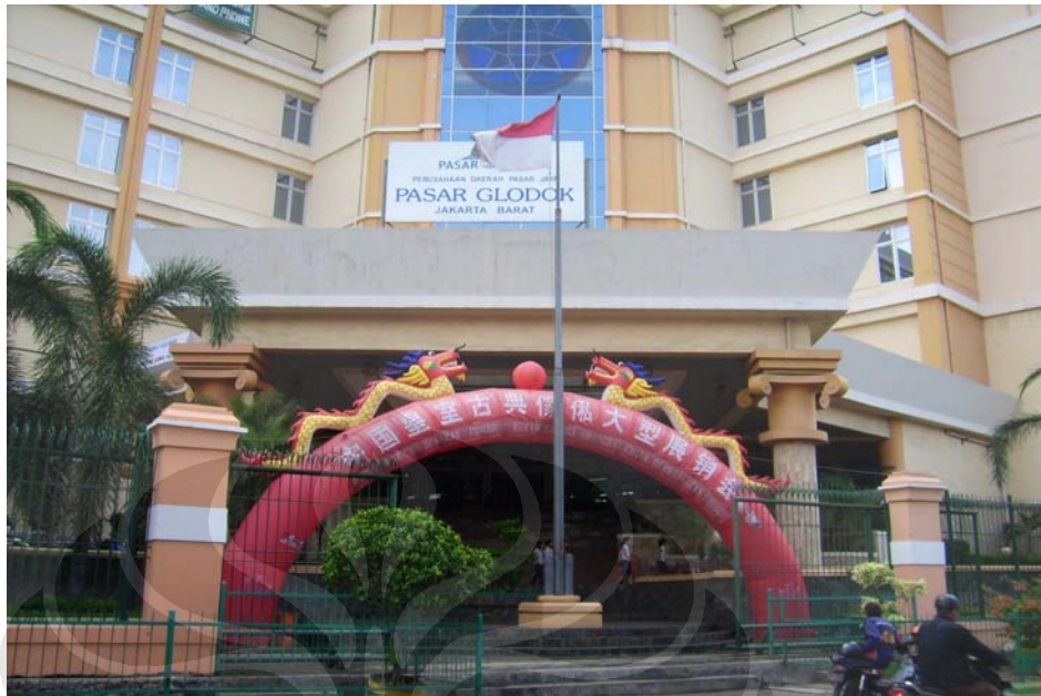
Pintu Masuk Utama Pasar Glodok dari Jl. Pancoran