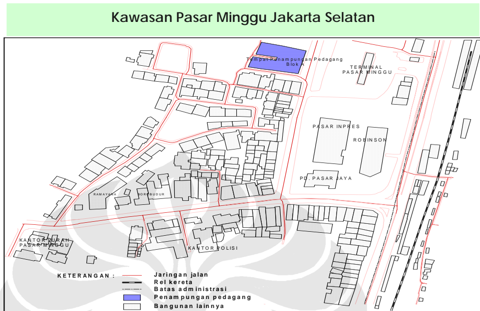
Gambar 2.1. Peta Kawasan Pasar Minggu Jakarta Selatan.