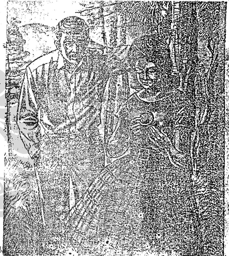
Gelang kuwi saka wong tuwaku dik Tin. Dudu anggonku njebrot.

Gagasane Guritno saja nglangut. Tekan dalame kangmase katon sepi tintrim bae. Guritno bandjur tjrita akeh karo kangmase sekalian, agawe anglesing panggalihe wong loro, luwih2 Bu Bei dewe. Wiwit iku Guritno man-