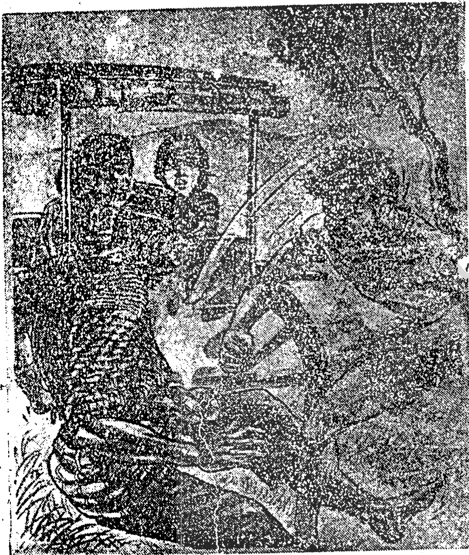
Kusir andong sing kuru mekingking diwales, sapisan ora sambat tiba ndjungkel.

sambat, tiba ndjungkel, tjangkeme ngetokake getih, lan mripate gondar-ganoir metjiijil karo gereng2 sambat lara, ora bisa tangi.