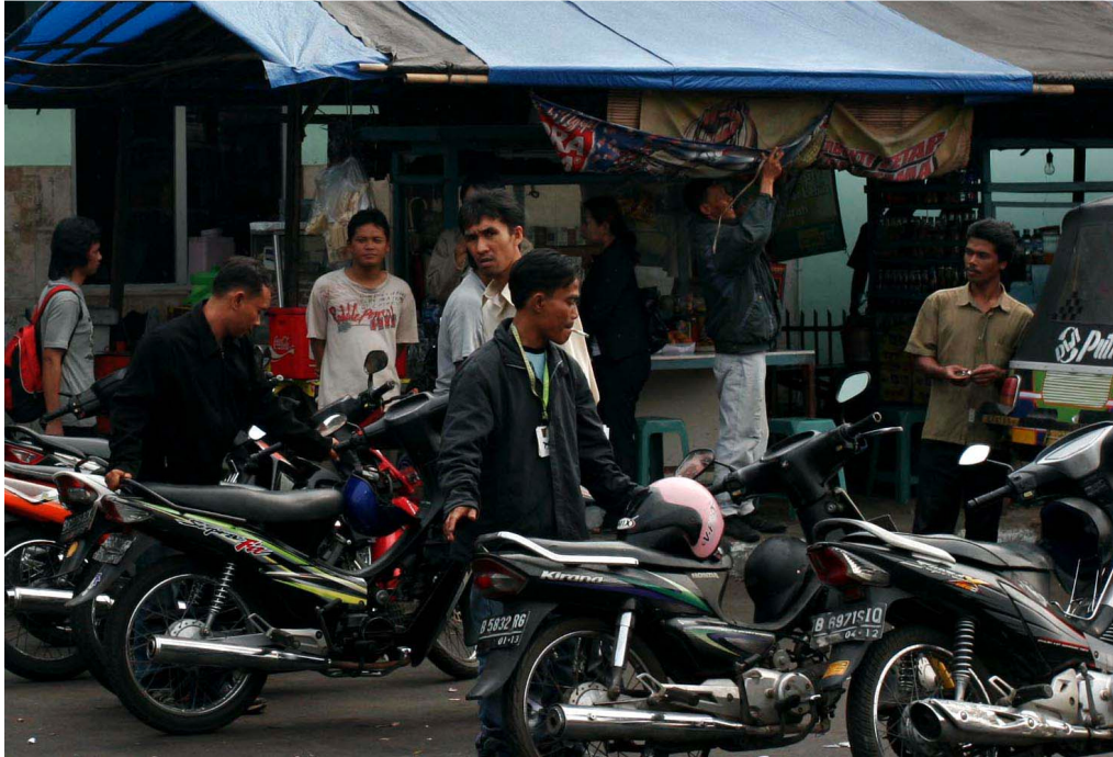
Gambar 8 Foto pengaturan pangkalan ojek pada saat penagihan uang pungutan