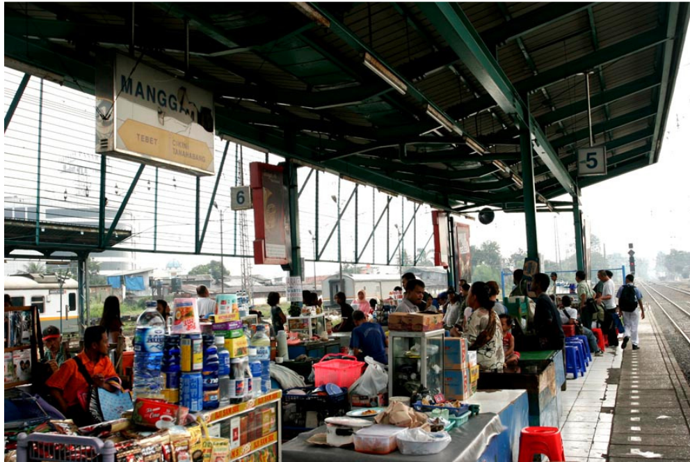
Gambar 6 Foto gambaran situasi di pojok utara peron 5 dan 6