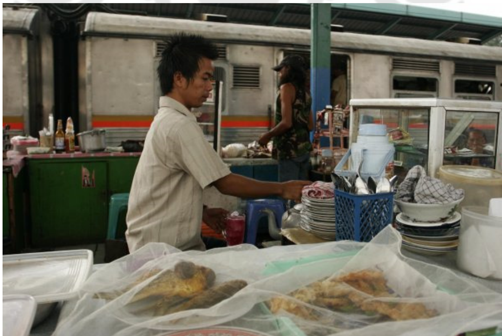
Gambar 9 Foto saat wawancara mengenai pembagian kerja antara pedagang meja dan tukang ojek