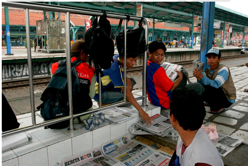
Gambar 7 Foto para penjual koran yang sedang menghitung dan mengumpulkan jumlah koran yang akan dijual