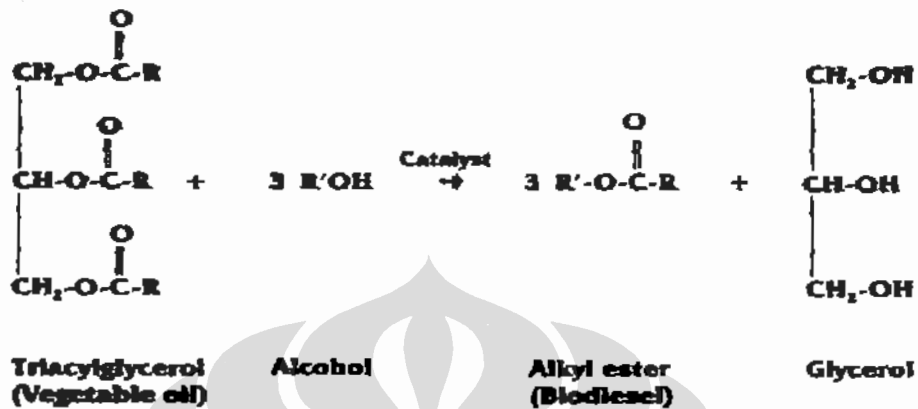
Gambar 2.1. Reaksi transesterifikasi [3]

transesterifikasi trigliserida dengan alkohol sehingga menghasilkan alkyl ester (biodiesel) dengan R merupakan rantai asam lemak dan R' adalah CH 3 jika reaksi menggunakan metanol.