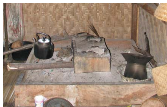
Gambar 2. Hawu (Tungku dari Tanah Liat) dan Parako (Perapian) Baduy

Masyarakat Baduy memiliki kearifan tersendiri untuk mencegah hama pengganggu padi dalam lumbung. Pada bagian dinding lumbung biasanya diselipkan tujuh jenis