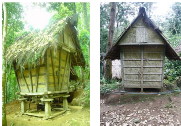
Gambar 3. Lumbung Ber- geuleubeug (Kiri) dan Biasa (Kanan)